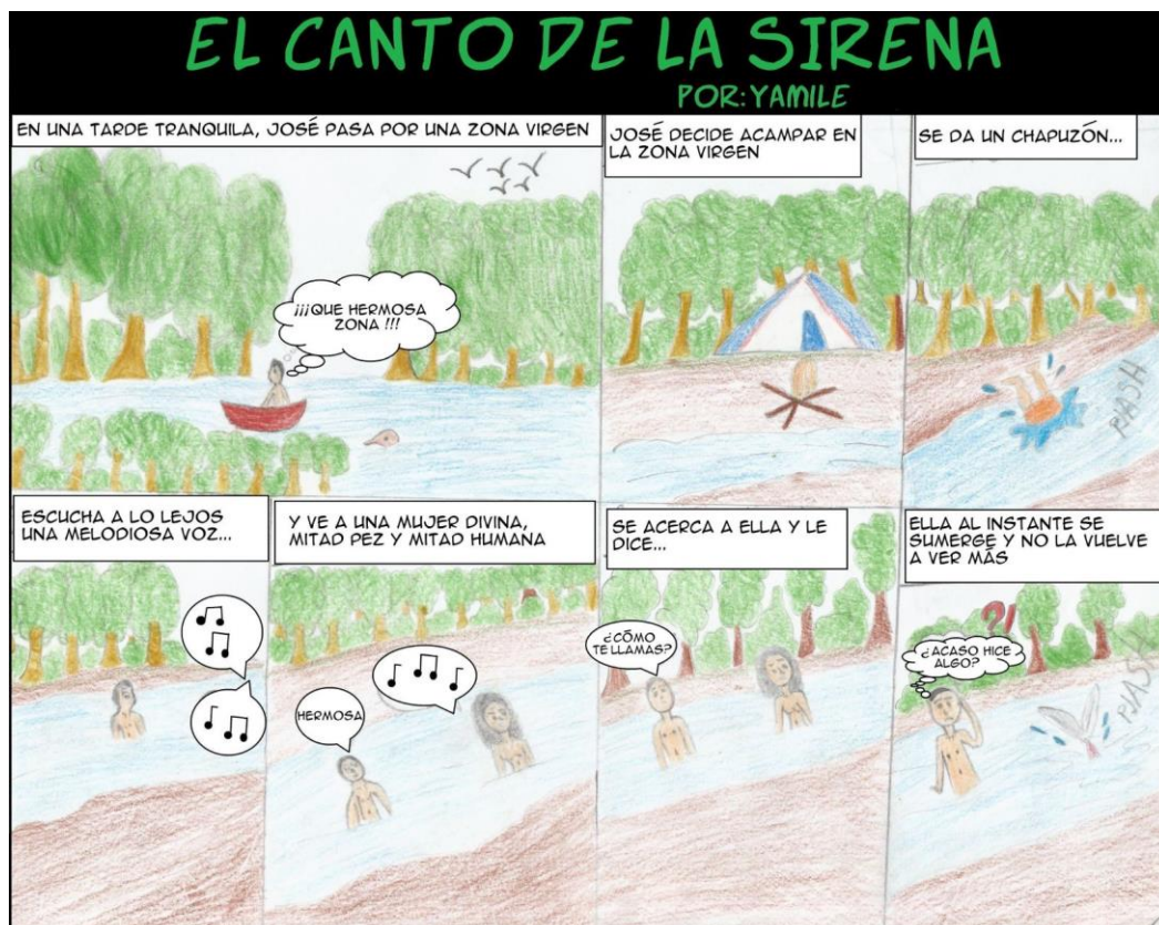
Imagen 3. Yamilé, El canto de la sirena