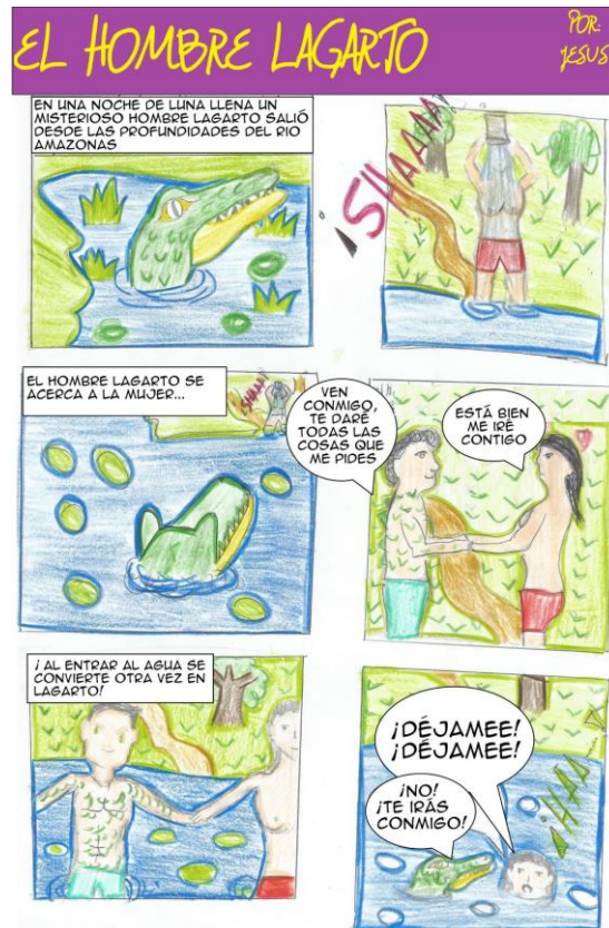
Imagen 2. Jesús, El hombre lagarto