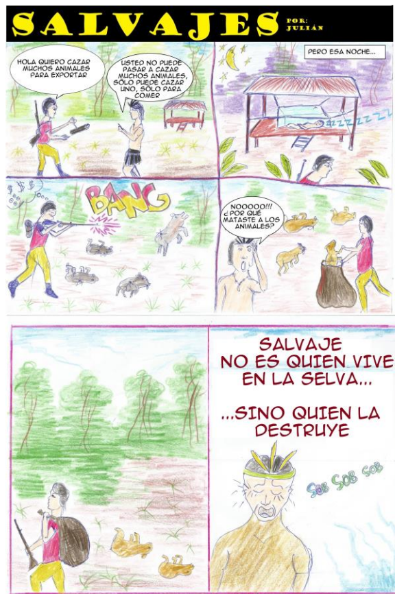
Imagen 5. Julián, Salvajes