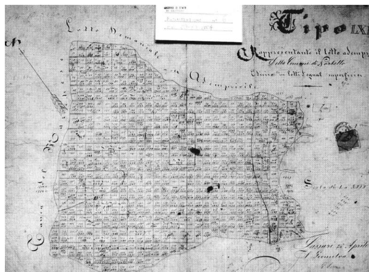
Fig. 3 – Piano di lottizzazione dei terreni ex-ademprevili del Comune di Norbello (1874).