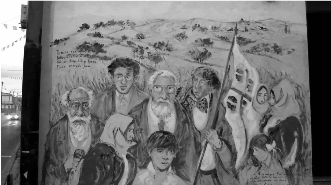
Fig. 4 – Villamar 2015: murale degli anni Novanta sulla storia della Sardegna rurale. I noti versi attribuiti a Melchiorre Murenu ( Tancas serradas a muru... ) in alto a sinistra riconducono l'opera ai moti popolari contro le chiudende. (Foto di F. Parascandolo).