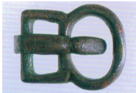
Fig. 3: CAGLIARI – Vico III Lanusei. Tomba A.44: fibbia di cintura (da DEIANA 2006: fig. 223).