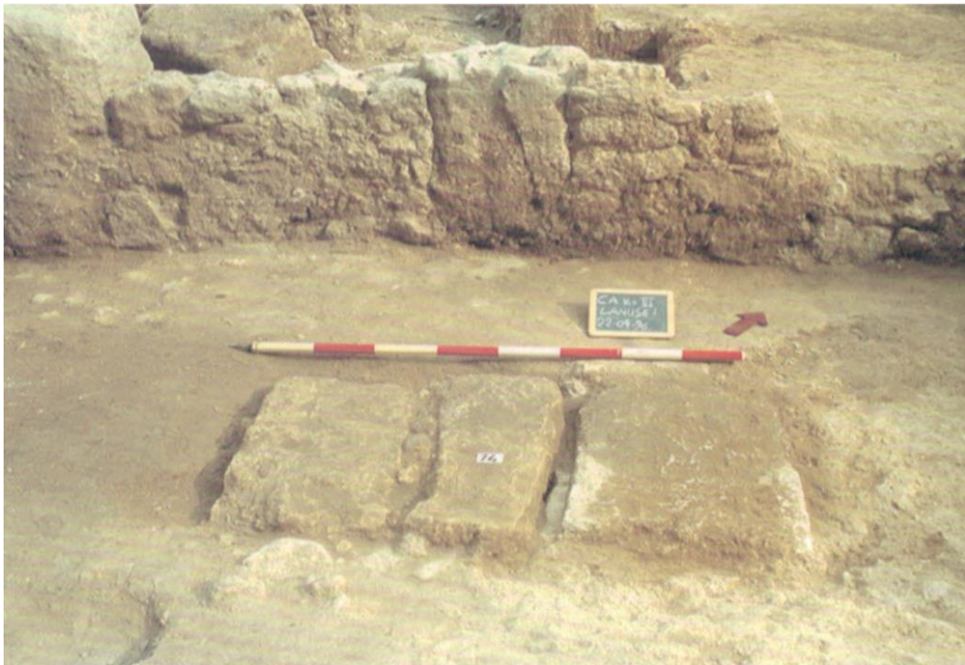
Fig. 2: CAGLIARI – Vico III Lanusei. Tomba A.44 (da MUREDDU 2006: fig. 65).