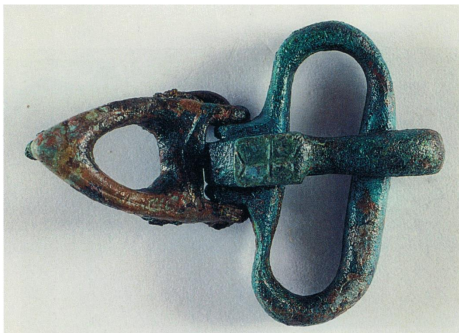
Fig. 8: SELARGIUS – San Lussorio. Tomba II/2001, cosiddetta “Tomba della cintura”: fibbia bronzea di tipo “Bologna” (da MANUNZA 2013: fig. 18).