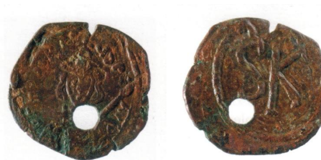
Fig. 9: SELARGIUS – San Lussorio. Tomba II/2001, cosiddetta “Tomba della cintura”: mezzo follis di Tiberio III Absimaro (698-705) dalla cintura costituita da monete forate e denti atrofici di cervo (da MANUNZA 2010: fig. 172).