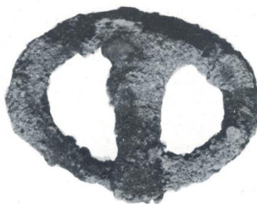
Fig. 12: NURACHI – Chiesa di San Giovanni Battista. Tomba v: fibbia di cintura (da STEFANI 1985: tav. 56.4).