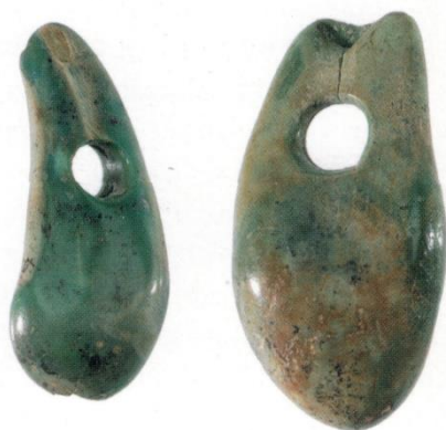
Fig. 7: SELARGIUS – San Lussorio. Tomba II/2001, cosiddetta “Tomba della cintura”: canini atrofici di cervo (da MANUNZA 2010: fig. 175).