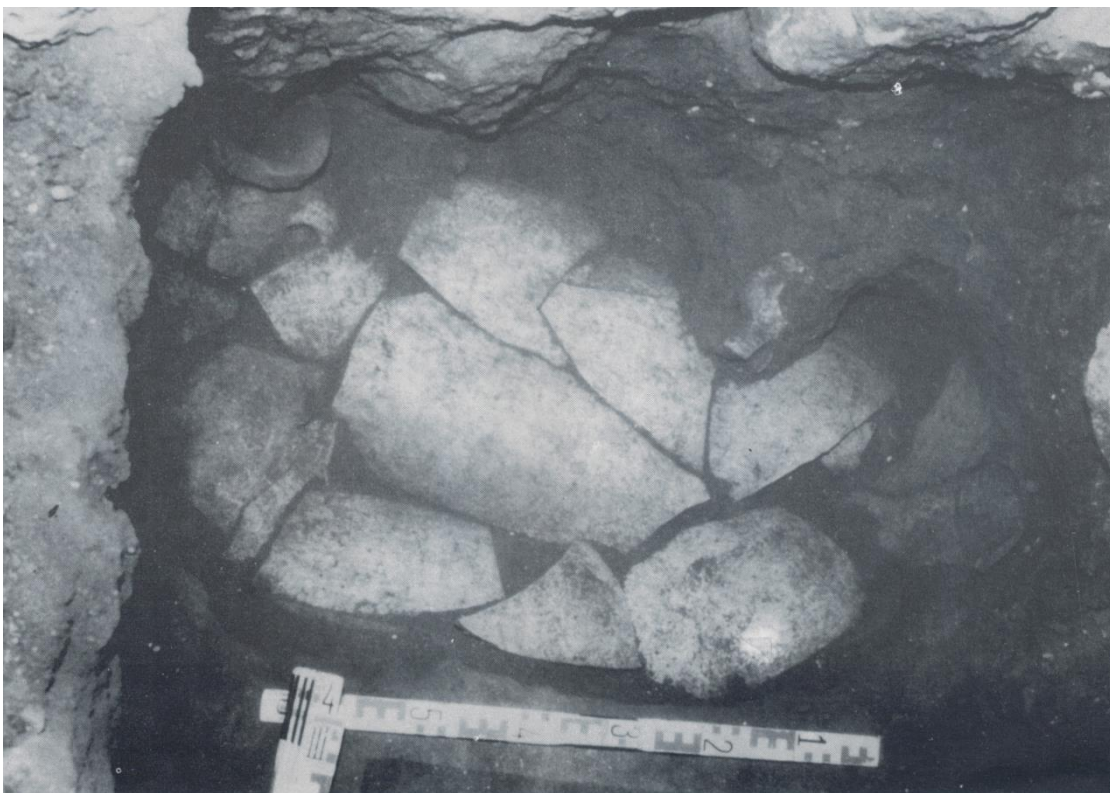
Fig. 11: NURACHI – Chiesa di San Giovanni Battista. Tomba v: veduta prima dello scavo (da STEFANI 1985: tav. 54.2).