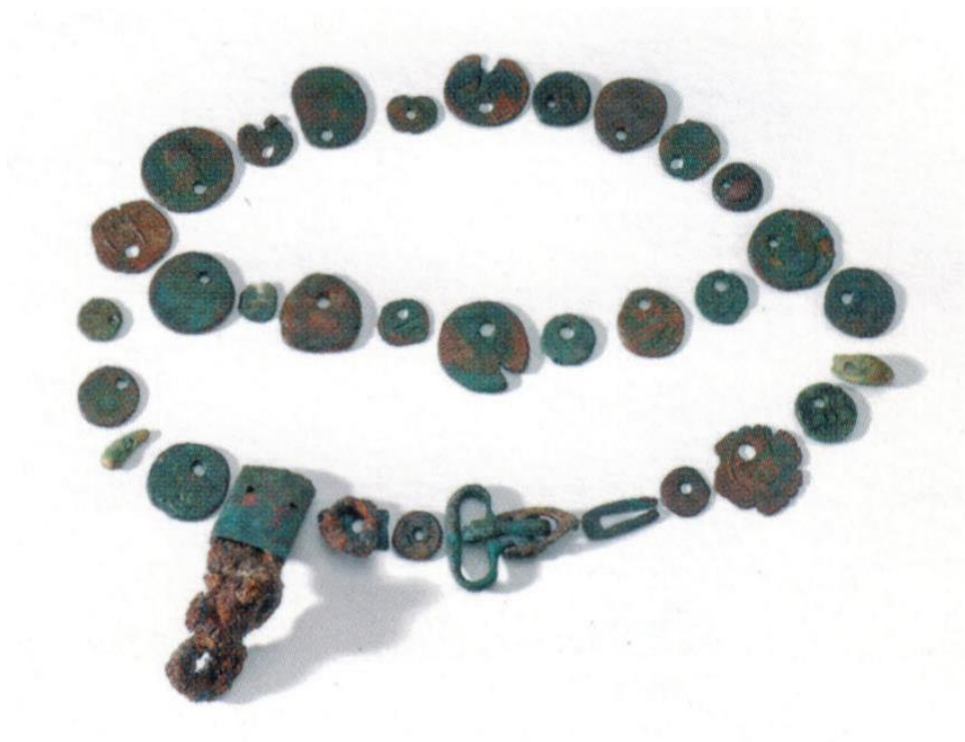
Fig. 6: SELARGIUS – San Lussorio. Tomba II/2001, cosiddetta “Tomba della cintura”: ricostruzione della cintura (da MANUNZA 2010: fig. 170).