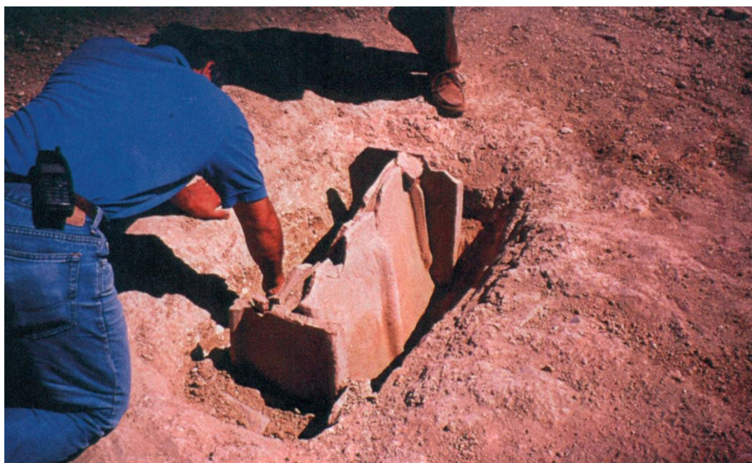
Fig. 4: SELARGIUS – San Lussorio. Tomba II/2001, la cosiddetta “Tomba della cintura”, in corso di scavo (da MANUNZA 2013: fig. 2).