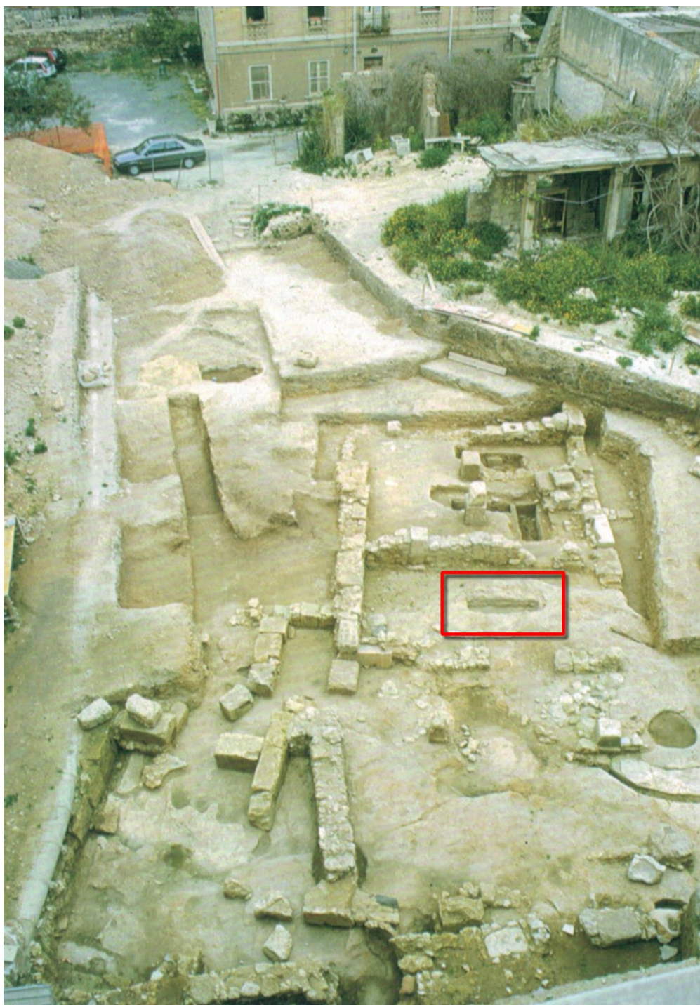
Fig. 1: CAGLIARI – Vico III Lanusei. Veduta generale dell'area archeologica. In rosso la tomba A.44 (rielab. S. Tacconi da MUREDDU 2006: fig. 41).