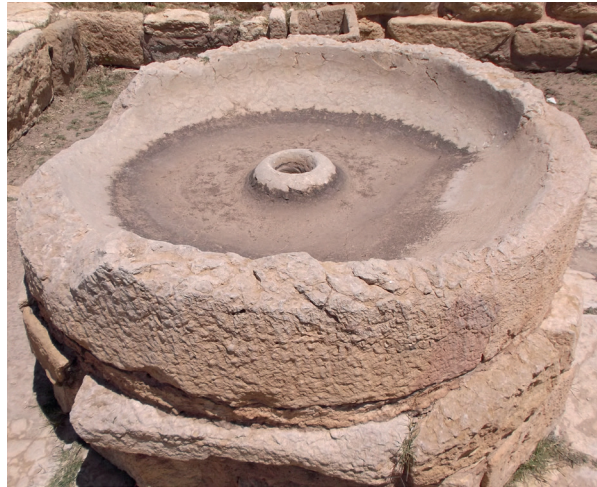
Fig. 6. Plateau de Sufetula

correspond pas aux trapeta décrits par Caton et interprétés par Brun et Frankel 28 . Ce type, répandu en Afrique romaine et attesté en Egypte 29 , est une sorte de plateau où les lèvres mesurent quelques centimètres de hauteur, le plus souvent entre 20 et 30 cm, et doté au centre d'un orifice pour la fixation de l'axe central. Cet orifice peut correspondre à un trou de forme circulaire, quadrangulaire ou aussi un bourrelet cylindrique. Le nombre de ces moulins est élevé : 297 éléments ont été comptabilisés entre plateaux (175 objets) et meules (122 objets) 30 mais les indices de datation sont ténus. Quant à la répartition spatiale, la plus grande