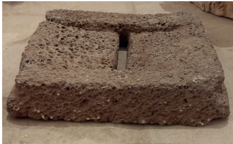
Fig. 1. Moulin à trémie de Kerkouane (Souissi (2020), II, 16).

Pour la mouture des grains, il semble que, jusqu'à l'époque augustéenne, l'Afrique proconsulaire importe les moulins à bras de la Sardaigne et de Pantelleria, comme l'indiquent les deux seules pièces datées trouvées à Carthage et à Kerkouane 21 . Dans cette dernière ville, on constate que jusqu'au milieu du III e siècle av. J.-C., date de l'abandon du site selon J.-P. Morel, le moulin à trémie resta la technique la plus utilisée pour la transformation du grain malgré une persistance remarquable des meules antérieures (objets de type néolithique) 22 . Les fouilles sur le site de Kerkouane ont mis au jour une collection de 29 meules de typologie variable : 03 meules de mouvement alternatif, 25 meules à levier et une seule meta de type rotatif manuel 23 .