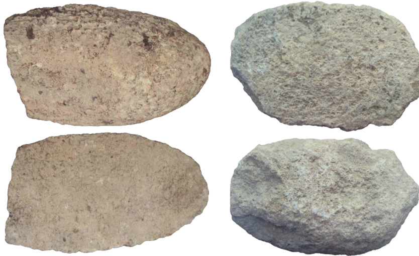
Fig. 3. Meules du site numide d'Althiburos (Sanmarti et al. (2016), 275-176).

lins à sang de type pompéien. Cette influence italienne pourrait expliquer la large diffusion de ce dernier type en comparaison avec le modèle à bras (on n'a recensé que 78 meules à bras contre plus de 400 meules à sang). Il faut juste rappeler que la première attestation archéologique des moulins de type pompéien date du I er siècle de notre ère avec les trouvailles de Pompéi et Ostie.