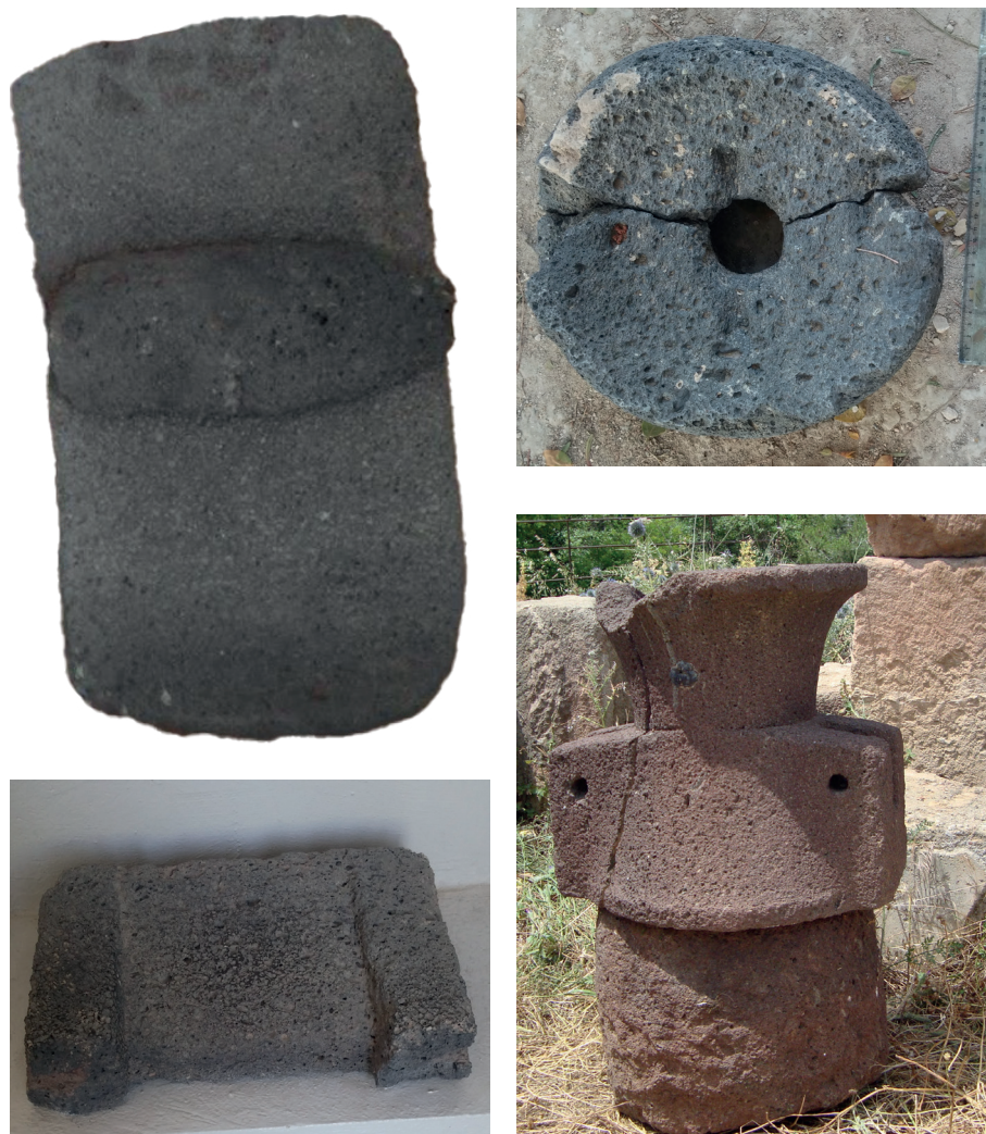
Fig. 2. Collection des différentes meules trouvées à Carthage ( moulin à trémie, meule néolithique, moulin rotatif à bras, moulin de type Morgantina)

pas forcément des chronologies différentes, et que l'apparition et la diffusion d'un certain type ne cause pas l'abandon du type qui lui précède.