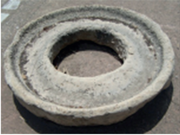
Fig. 4. Plateau de Carthage.