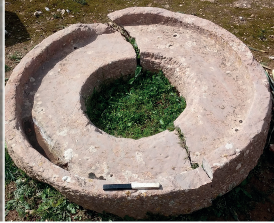
Fig. 5. Plateau de Bulla Regia.

correspond pas aux trapeta décrits par Caton et interprétés par Brun et Frankel 28 . Ce type, répandu en Afrique romaine et attesté en Egypte 29 , est une sorte de plateau où les lèvres mesurent quelques centimètres de hauteur, le plus souvent entre 20 et 30 cm, et doté au centre d'un orifice pour la fixation de l'axe central. Cet orifice peut correspondre à un trou de forme circulaire, quadrangulaire ou aussi un bourrelet cylindrique. Le nombre de ces moulins est élevé : 297 éléments ont été comptabilisés entre plateaux (175 objets) et meules (122 objets) 30 mais les indices de datation sont ténus. Quant à la répartition spatiale, la plus grande