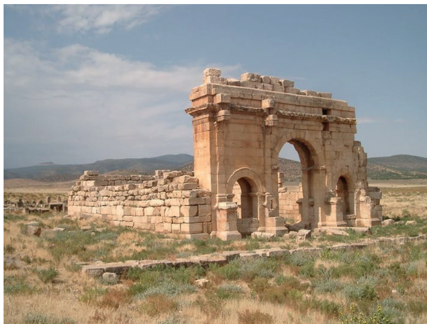
Fig. 7. Dalla donazione Laporte. Diana Veteranorum . Arco di Macrino (217 d.C.)