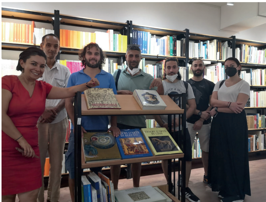
Fig. 1. Interno della Biblioteca Moscatti. Nella foto alcuni soci SAIC in visita.