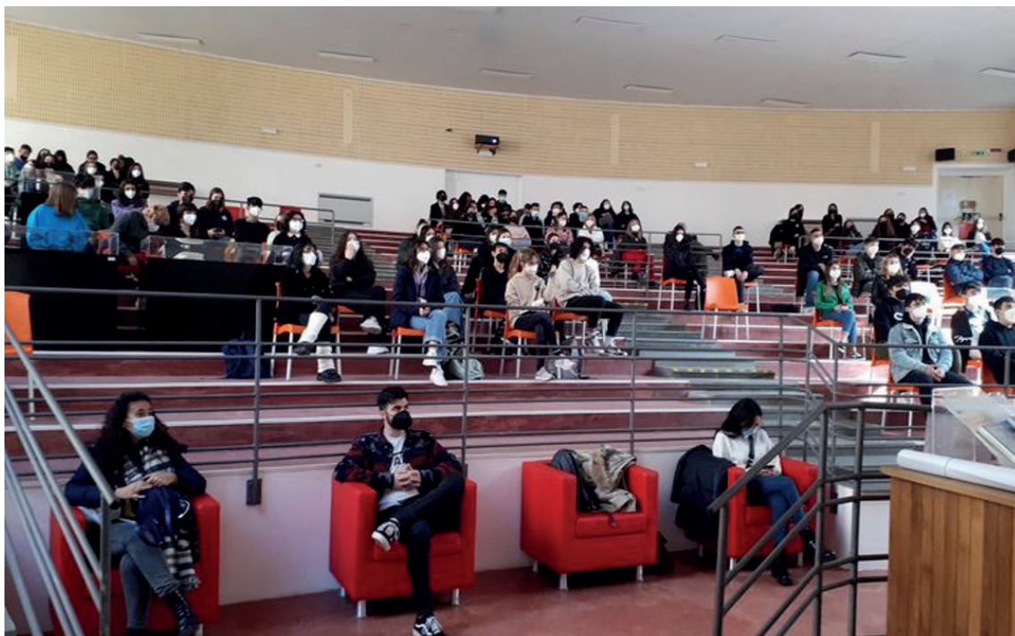
Fig. 3. Cagliari. Liceo Classico «Dettori». Aprile 2022. Incontro con gli studenti nel quadro del progetto #valueCARTHAGE promosso dal DADU. Università degli Studi di Sassari.