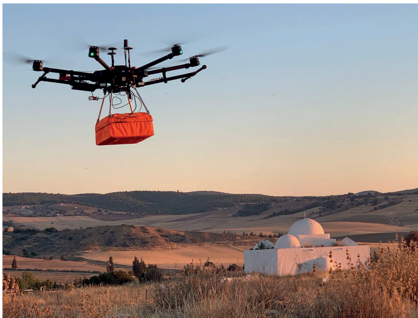
Fig. 2. Avioccala (Hr Sidi Amara, Tunisia). Attività geognostiche. Progetto LARNA (coord. Hamden Ben Romdhane e Valentino Gasparini).

Kairouan). Gli obiettivi principali del progetto, in collaborazione scientifica con l'Institut National du Patrimoine, erano lo studio del processo di neolitizzazione nel Maghreb orientale e la ricostruzione del modello economico e il grado di mobilità dei gruppi umani stanziati lungo la dorsale tunisina durante il VI millennio a.C., con un'indagine del sito all'aperto di Doukanet el Khoutifa, situato sull'altopiano di El Gueria, Siliana. Questo sito può essere considerato il più importante villaggio neolitico riportato alla luce nel Maghreb orientale.