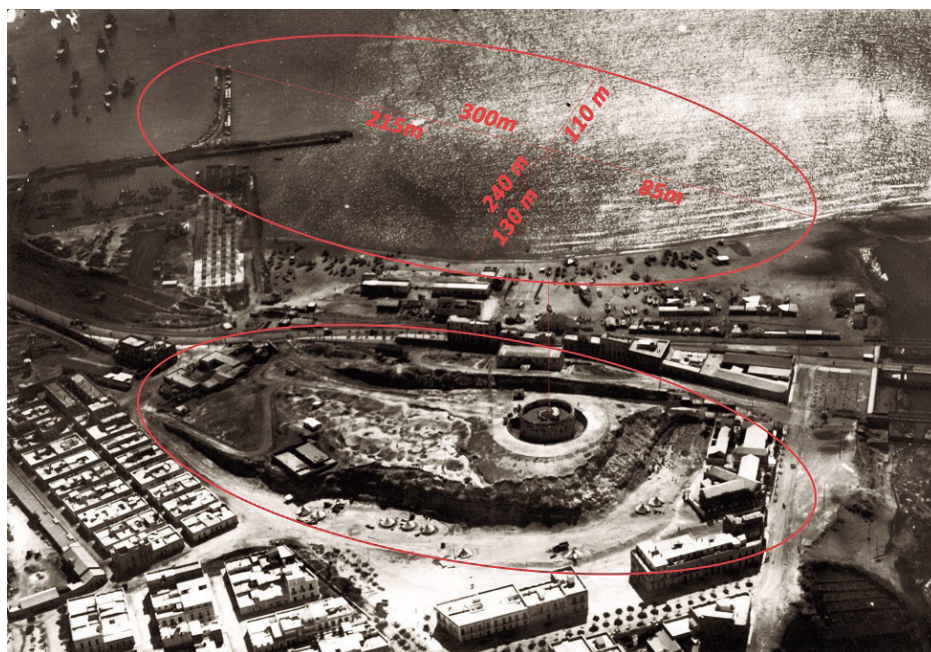
Figura 3. Dimensiones y situación de la Necrópolis del Cerro de San Lorenzo, año 1923 ( Rusaddir , Melilla).