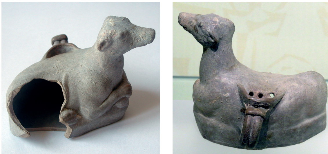
Figura 4. Parte delantera (1) y trasera (2) del guttus procedente del Cerro de San Lorenzo, Rusaddir (actual Melilla). Museo de la Ciudad Autónoma de Melilla.

«no se guardase la unidad de los ajuares y se mantuvieran por separado», por lo que el análisis se realizó en conjunto, mediante fotografías enviadas desde Melilla.