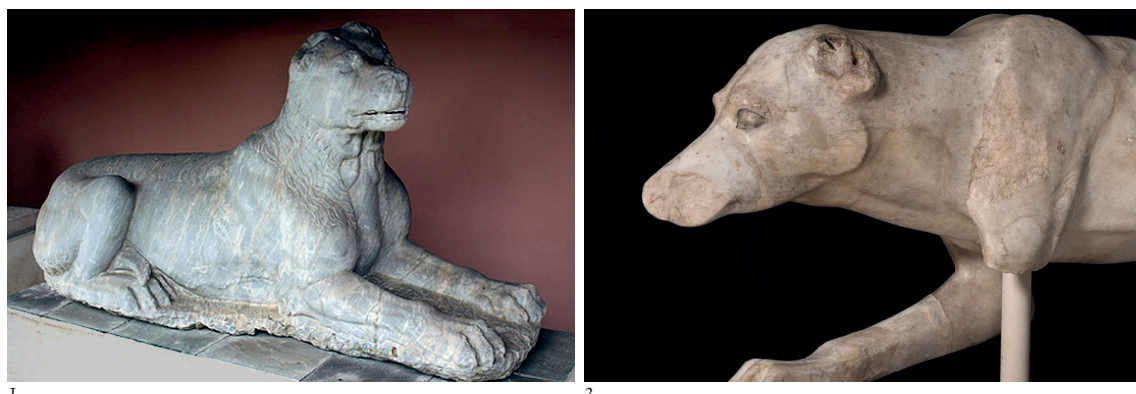
Figura 1. 1. Escultura de perro (posiblemente raza molossus) procedente de la Necrópolis de la Kerameikos, en Atenas al noroeste de la Acrópolis (Museo Oberlaender; foto de la reproducción en yeso del Metropolitan Museum of Art. Central Park. New York.); 2. Cabeza de posible perro de raza laconiana, puede haber pertenecido al Témenos de Artemis Brauronia (Brauron) adyacente a los Propíleos en la Acrópolis. Se atribuye a la época de Pisistrato o sus hijos (520 a.C.). Museo de la Acrópolis, Atenas. Diferente era el Melitaeus catullus (Ref. Acr. 143; Foto Archivo P. Fernández Uriel).

y Hécate, (que también está atestiguada en el mundo fenicio-púnico como analiza A.M a Niveau de Villedary) 7 incluso su fuerza y perseverancia le convierte en un monstruo mitológico como Cerberus , el perro de tres cabezas, guardián del Hades 8 .