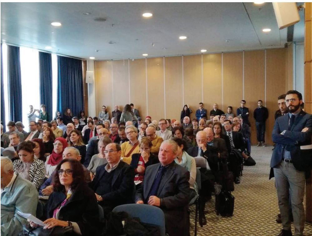
Immagini del Convegno. Hotel Africa, Tunisi. 7 dicembre 2019