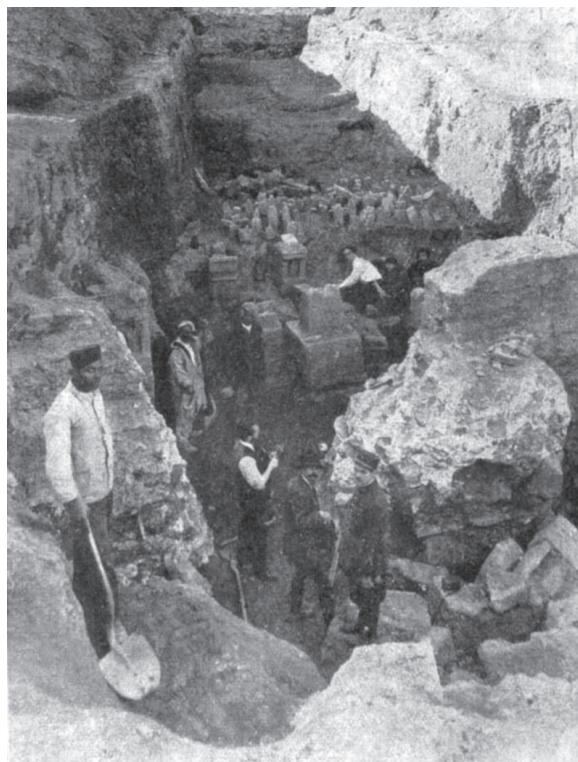
Fig. 2. Les fouilles de François Icard à Carthage.

ne manque pas de constater, quoique toujours avec beaucoup de respect pour des approches qui ne sont pas historiques au sens propre. Mais il demeure réservé, notre Auteur, devant la pléthore d'informations, de commentaires et même de nouvelles idéologies qu'il a dû collectionner : il n'avance pas des solutions, il ne sort pas de ces limbes.