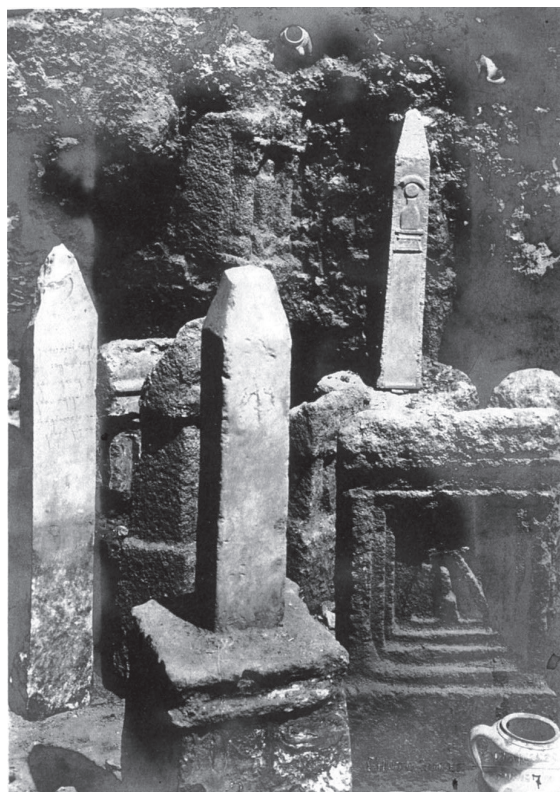
Fig. 4. Cippes et stèles dans la fouille di « temple de Tanit » à Carthage.

Méditerranée punique ; comme il n'y a pas eu, très probablement, une seule façon d'utiliser ces lieux consacrés.