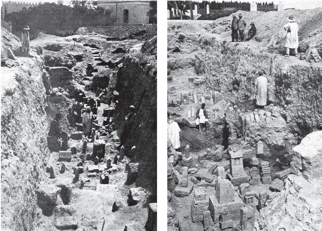
Fig. 1. Vue d'ensemble de la fouille du temple de Tanit : autels et stèles en étages superposés marquant différentes étapes de civilisation. (légende de L'illustration , 8 juillet 1922).

et de l'autre a pourchassé les positions contraires (en tout ou en partie) à l'hypothèse d'une mise à mort rituelle de ces bébés.