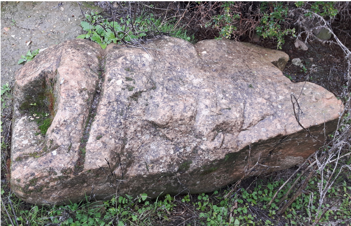
Fig. 12. Fragment d'un contrepoids.