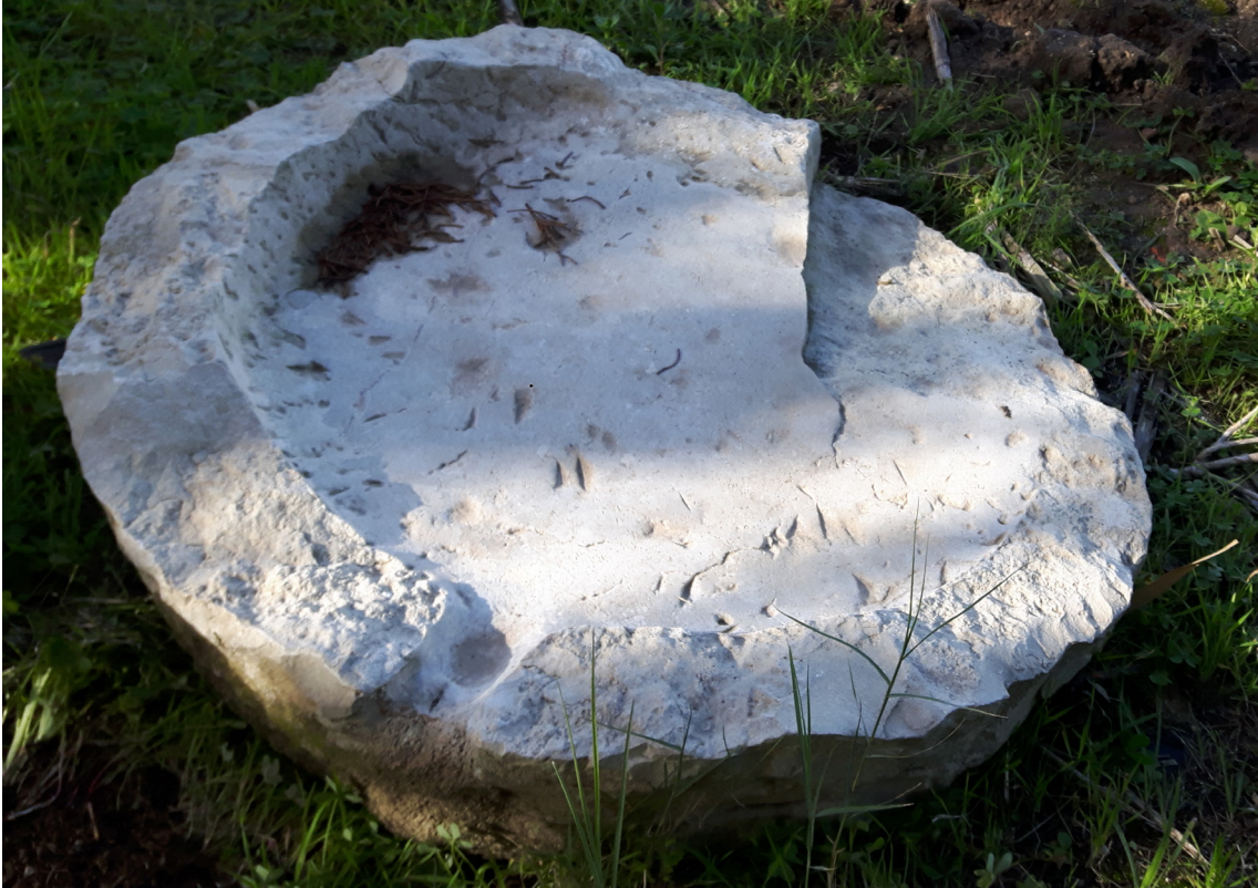
Fig. 11. Un plateau de pressoir.