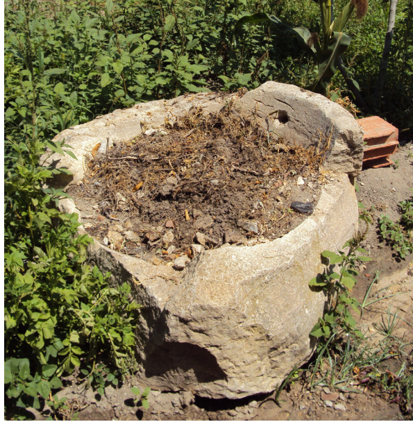
Fig. 9. Un mortier.