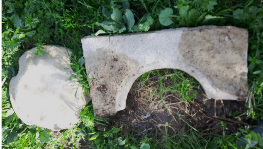
Fig. 7. Fragment de margelle et un couvercle en pierre.