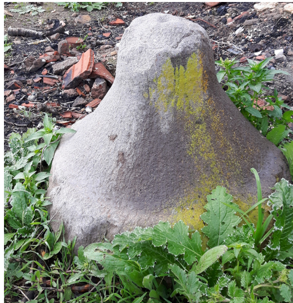
Fig. 10. Une meta .

Le terre sur lequel se trouvent les maisons récentes ne semble pas être un simple fait naturel. Il s'agit très probablement de vestiges archéologiques revêtus par leurs décombres. Les travaux de terrassement de ce terre ont mis au jour, outre des blocs de taille et des éléments architectoniques et surtout les tronçons de fûts de colonne, quatre inscriptions latines (Fig. 13, 14, 15 et 16) dont l'une comporte le nom de la ville antique "Abzira" qui correspond à l'actuel Ouzra 74 , auxquelles s'ajoute une inscription arabe à double faces conservée dans la cour d'une maison et qui sera ultérieurement traitée dans un travail à part.