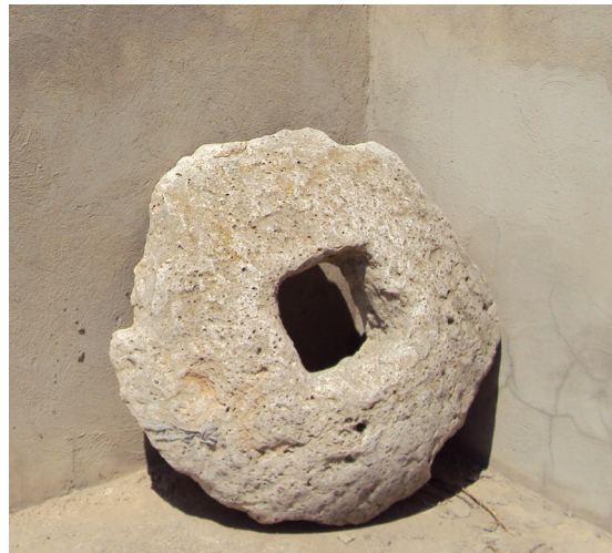
Fig. 8. Un broyeur en lave.

volcanique 71 (Fig. 10). Enfin, nous mentionnons deux fragments d'un catillus en calcaire blanc conservé en partie (Fig. 6) et un plateau de pressoir soigneusement taillé dans le calcaire blanc 72 (Fig. 11). Le site comporte aussi deux contrepoids d'huilerie : le premier, brisé, en calcaire blanc de type A se trouve dans un jardin non loin d'une maison. Le second, se trouve dans les alentours du mzar de Sidi Khelifa, est sans rainure (Fig. 12) 73 .