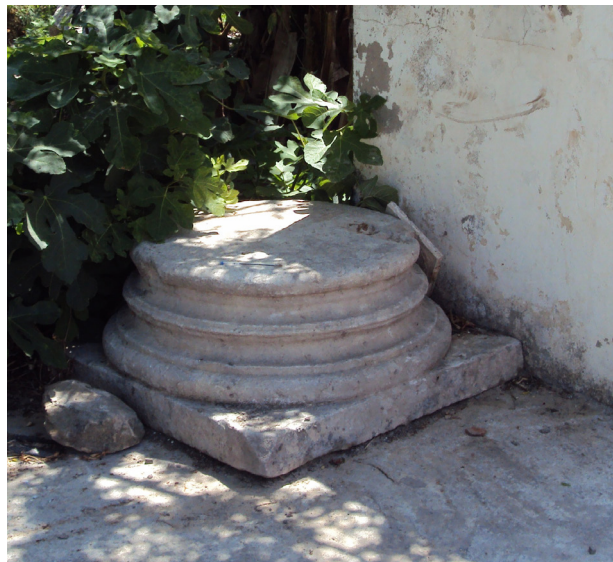
Fig. 5a. Base de colonne.

lit de mortier de chaux et une rangée de moellons. Les gros blocs sont liés avec un mortier de chaux chargé de terre cuite concassée. Les deux autres structures sont un pan de mur d'environ un mètre de longueur et une structure de forme circulaire, les deux étant en petit appareil et au ras du sol. Rien ne permet aujourd'hui de supposer à quels monuments appartenaient ces trois structures.