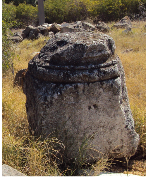
Fig. 3. Une base de colonne.