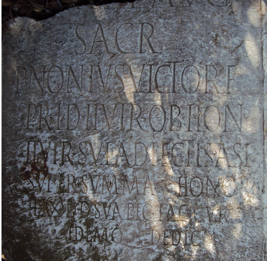
Fig. b. Dédicace religieuse.

Datation : plutôt le II e que le III e siècle (d'après le style d'écriture).