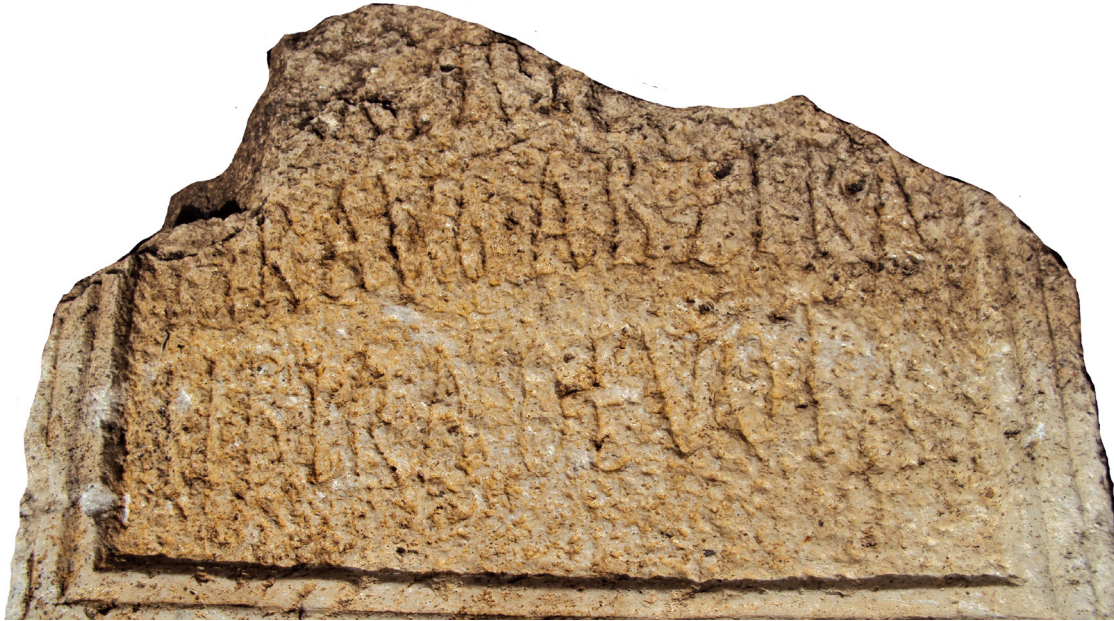
Fig. a. Détail de l'hommage rendu à un empereur.

Contexte de la découverte : voir infra , troisième partie de cette étude, inscription 2.