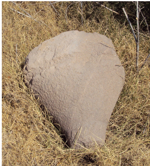
Fig. 4. Une meta en lave.

et par un cimetière musulman dans les alentours de ce dernier, actuellement abandonné 65 . Le site a subi beaucoup de dommages ; excepté trois structures murales espacées, nous n'y voyons guère d'autres vestiges construits : la première structure 66 est formée de deux murs qui se rencontrent en formant un angle droit ; l'un, visible sur environ 0,60 m d'élévation, est de 4,10 m de longueur, l'autre, au ras du sol, est de 3 m de longueur. Il est difficile, dans l'état actuel, d'examiner minutieusement la technique de construction de cette structure et de fournir des constatations précises. La stratigraphie du mur visible est formée, horizontalement, de panneaux (Fig. 5) ; les uns sont occupés par des grands blocs disposés en boutisse et/ou en carreaux, les autres par un blocage banché dont le remplissage est assisé par l'alternance d'un