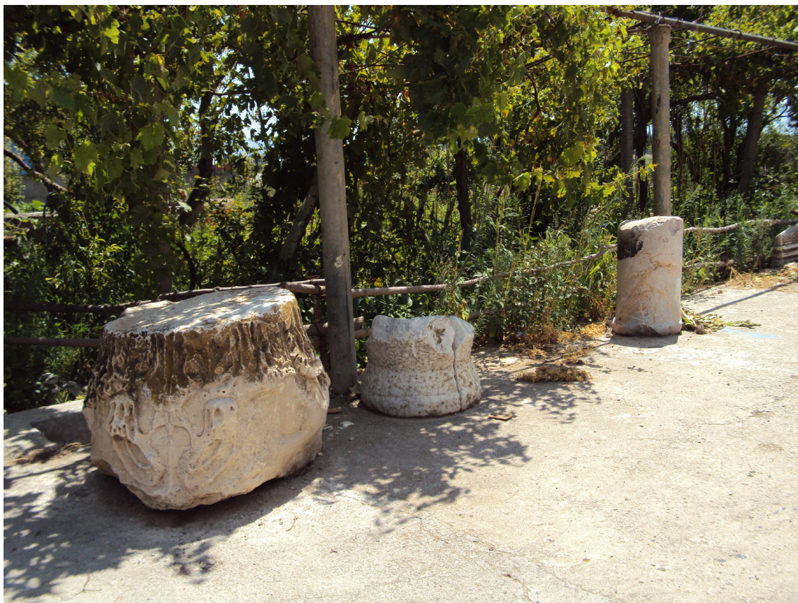
Fig. 6. Chapiteau corinthien, un fragment d'un catillus et un tronçon de fût de colonne.

une seule couronne de feuilles d'acanthé surmontées de volutes 68 (Fig. 6), deux fragments de fûts de colonne cannelée engagée, sept tronçons de fûts de colonne cylindrique de différentes dimensions et un tambour.