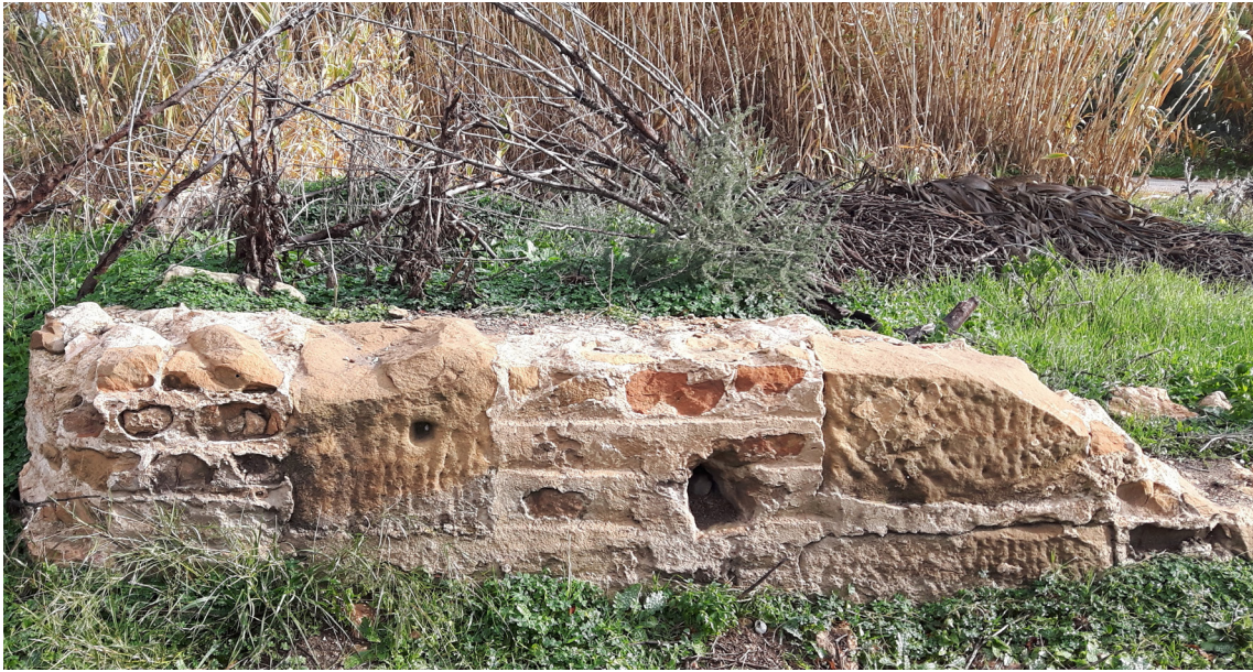
Fig. 5. Structure n° 1 : état actuel.