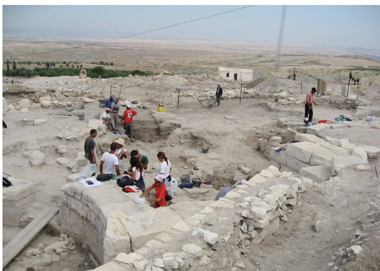
Missione archeologica dell'Università degli studi di Sassari a Zama Regia . Attività di scavo.

sua complessità – e di individuarne nel contempo la specificità.