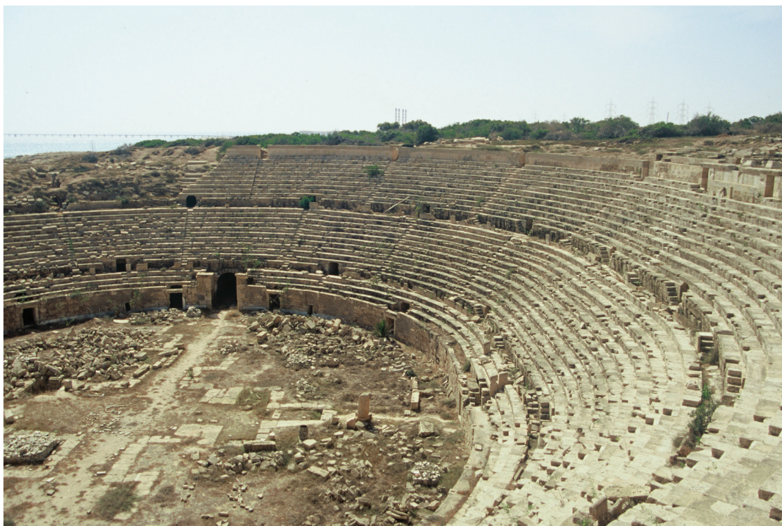
Anfiteatro di Lepcis Magna.

contributi di grande interesse e presentando un'enorme quantità di materiale inedito.