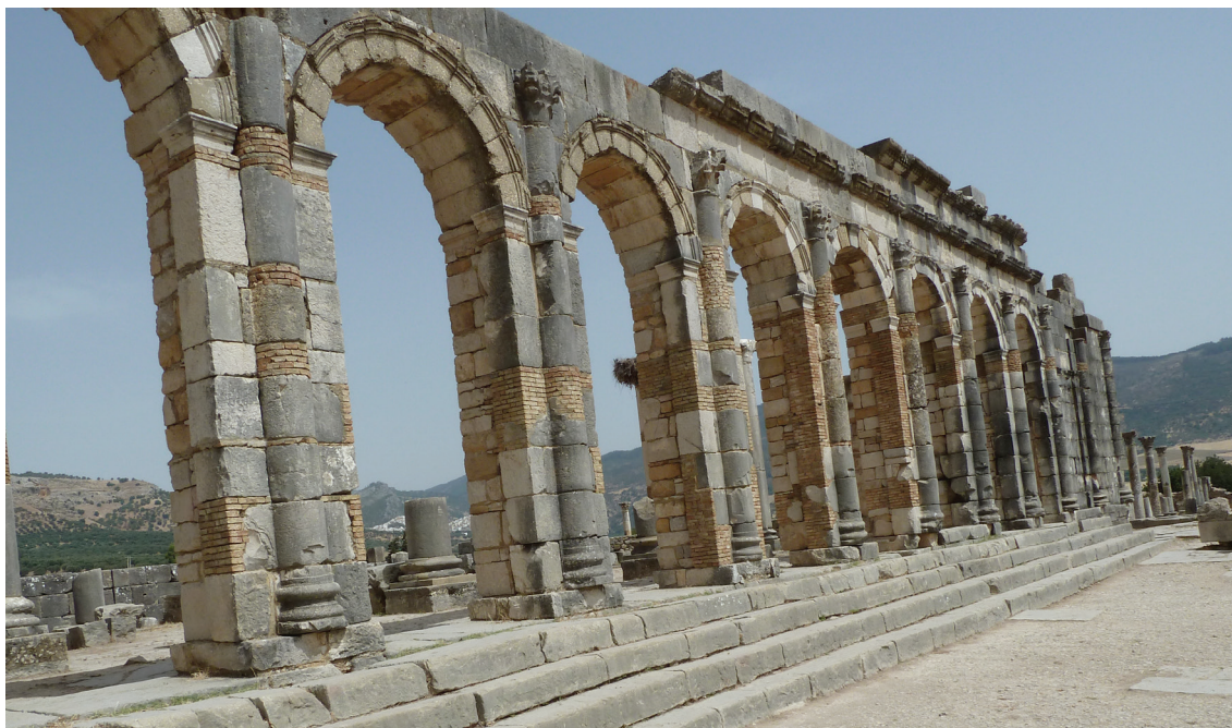
Volubilis : Basilica.

per la Difesa dei Diritti dell'Uomo ("Ligue Tunisienne pour la Défense des Droits de l'Homme", LTDH), dell'Ordine Nazionale degli Avvocati di Tunisia ("Ordre National des Avocats de Tunisie", ONAT).