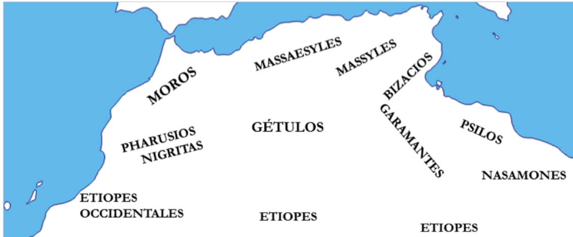
Fig. 1. Las poblaciones norteafricanas a partir de la descripción de Estrabón. Elaboración propia.

neo-púnica la que marcó la identidad oficial en las monedas acuñadas por las ciudades africanas hasta cuando menos la época del cambio de Era 13 . Y no está de más el tener en cuenta que en el Norte de África el uso más o menos corriente de la lengua púnica, si bien documentado expresamente tan sólo en la zona tunecina, aparece como un elemento muy difundido y prolongado, de hecho según la literatura hasta los tiempos mismos del final del África romana 14 . Así pues, destaca el que el elemento púnico se constituyera en un componente integrante y representativo de lo africano en el ámbito del dominio romano, y ello no tendría sentido de existir un fuerte rechazo entre unos y otros.