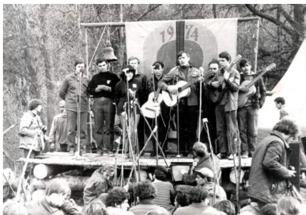
Fig. 3, Raduno ('slët') del KSP, 1974.

Jauz , Astra , Dnepr sono le marche dei primi, rudimentali, registratori che dalla metà degli anni Sessanta alla metà degli anni Settanta compaiono immancabilmente in ogni raduno, concerto, festival della canzone (Fig. 3).