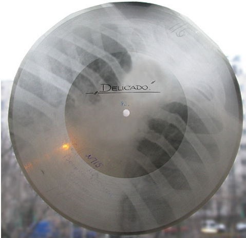
Fig. 1, Waldir Azevedo, Delicado .

incisione su cui sono impresse le voci di Little Richard, Aleša Dimitrijevič e dei cori di canto popolare (Spice 2016).