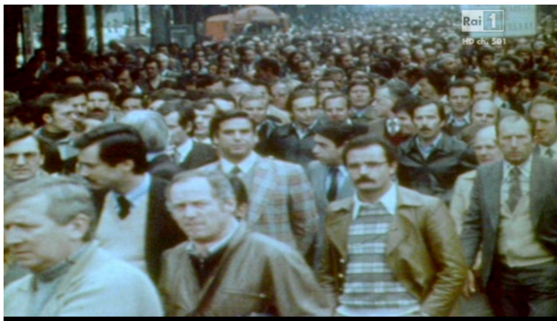
Fig. 6. Immagine d'archivio della marcia dei quarantamila montata subito dopo l'immagine di Venuti nel corteo.