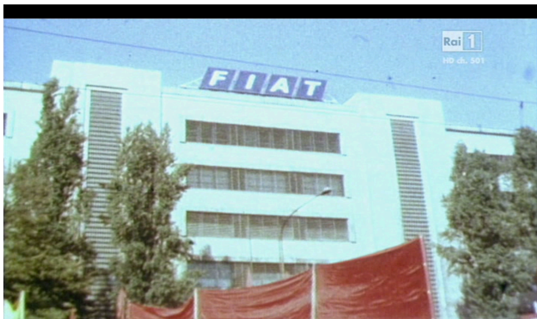
Fig. 2. Immagine d'archivio delle manifestazioni degli operai FIAT.