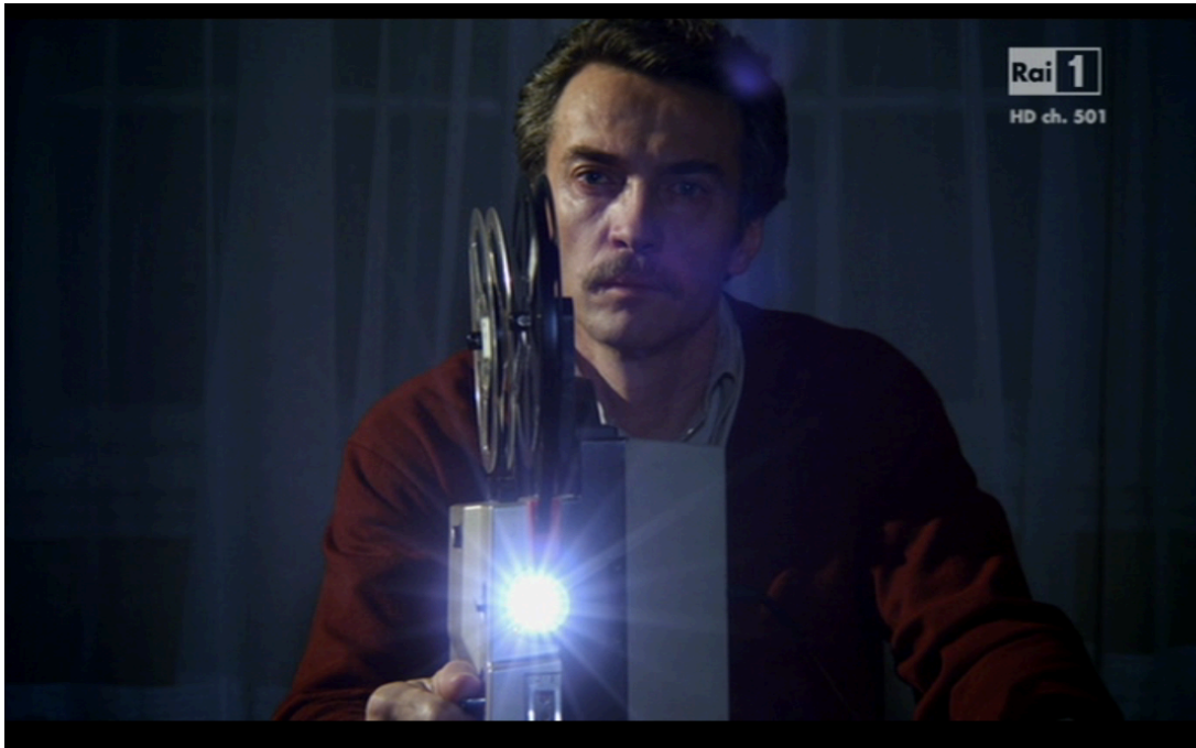
Fig. 3. Fotogramma successivo alle immagini d'archivio riguardanti le manifestazioni degli operai FIAT.