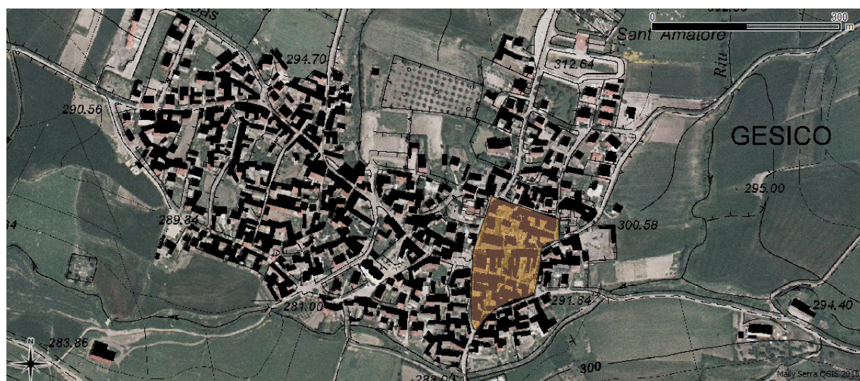
Fig. 8. Ipotesi di localizzazione del villaggio medievale.