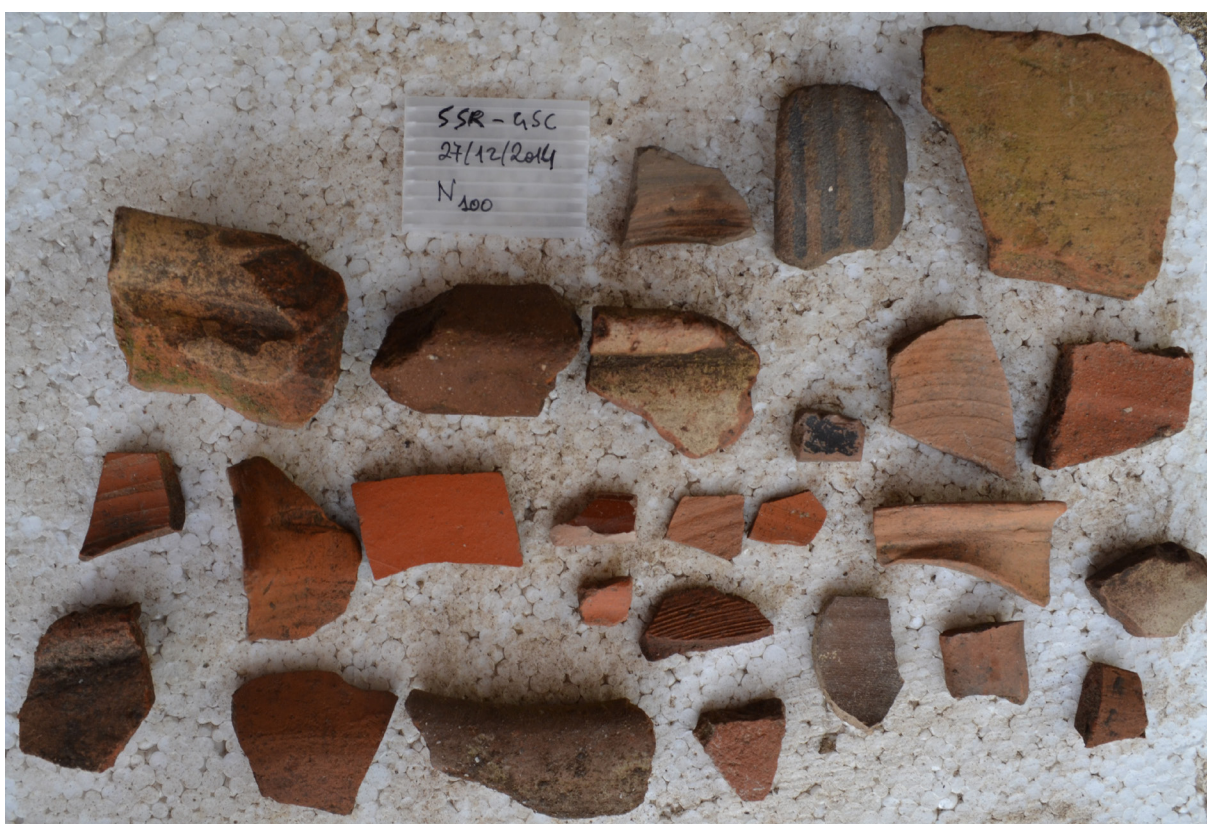
Fig. 6. Dettagli di alcuni reperti ceramici rinvenuti nel corso delle ricognizioni di superficie.