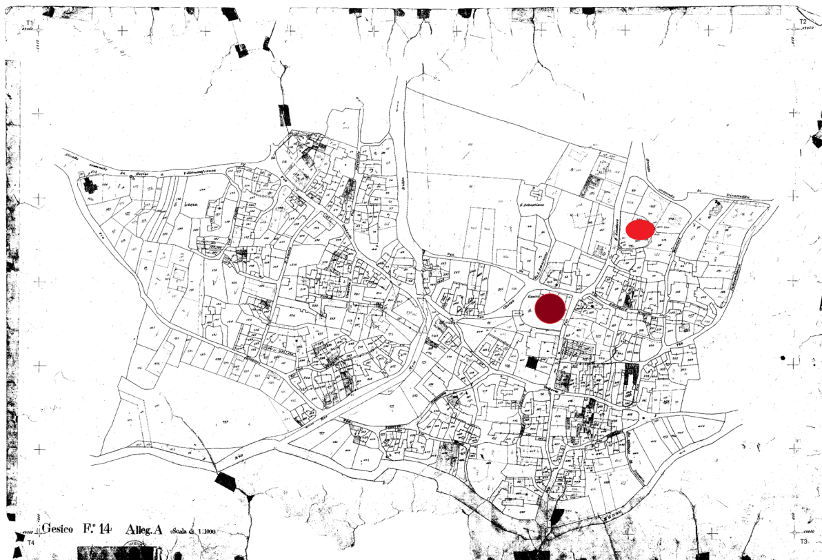
Fig. 7. Localizzazione delle chiese più antiche.