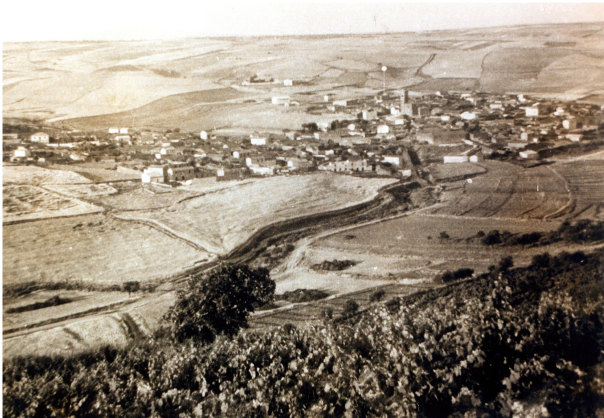
Fig. 2. Gesico in una foto d'epoca.