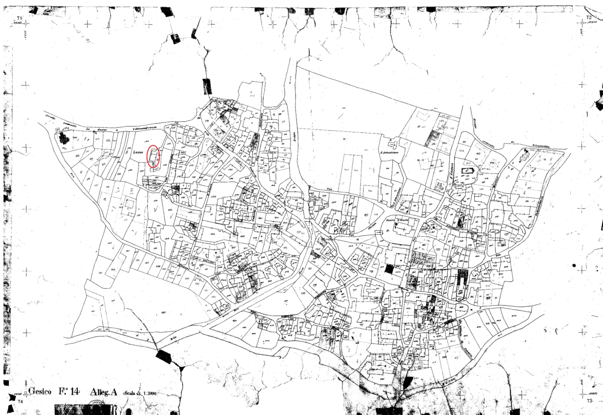
Fig. 4. Localizzazione dei ruderi della chiesa di S.Lucia nei mappali.