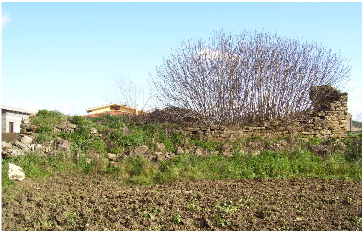
Fig. 5. I ruderi della chiesa di Santa Lucia.