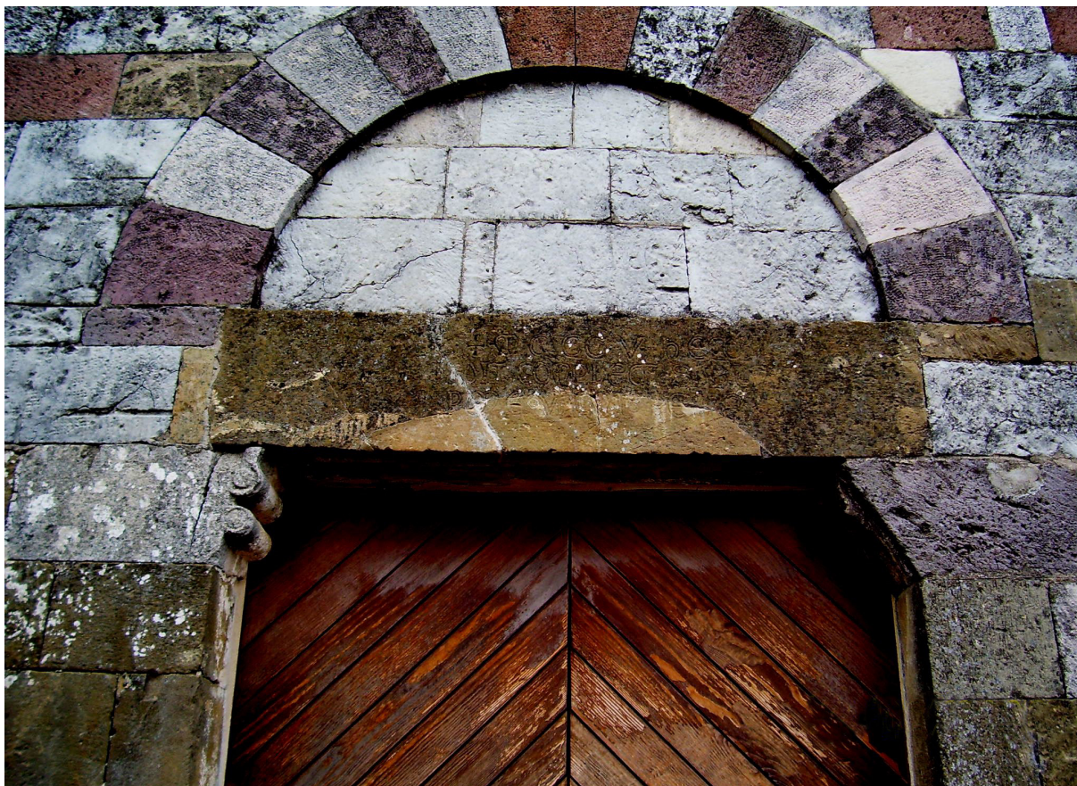
Fig. 3. Dettaglio architrave chiesa S.Maria d'Itria.