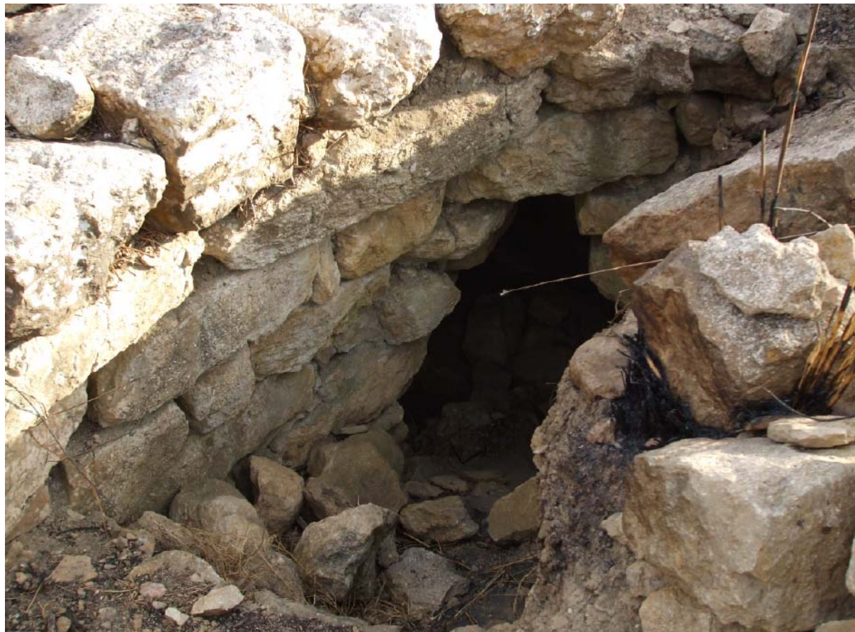
Fig. 3. Serrenti, Nuraxi Oliri A. Appostentu de sa turri manna.