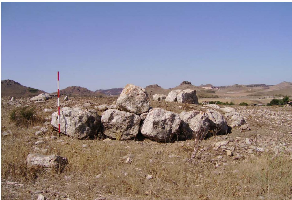
Fig. 2. Serrenti, nuraxi de Monti Crastu.