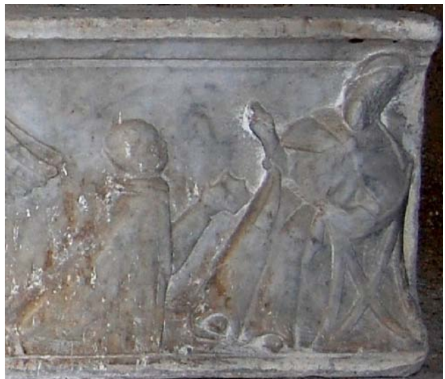
Tav. 2.2 Predella, Scena di offerta (Mauro Salis).