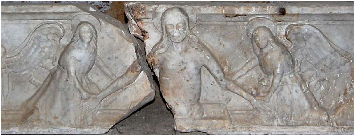
Tav. 1.2 Predella, Cristo in pietà con due angeli (Mauro Salis).