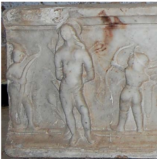
Tav. 2.1 Predella, Martirio di San Sebastiano (Mauro Salis).