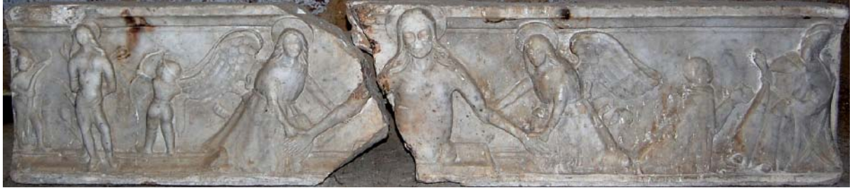
Tav. 1.1 Predella, Bitti, casa parrocchiale (Mauro Salis).

Virdis, F. 2006. Artisti ed artigiani in Sardegna in età spagnola . Villasor: Amministrazione comunale di Villasor.