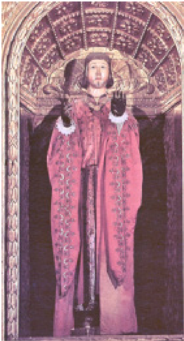
Fig. 13. Iglesias, duomo di Santa Chiara, retablo, Sant'Antioco , legno policromato, tessuto (da Murtas 1999, p. 102).