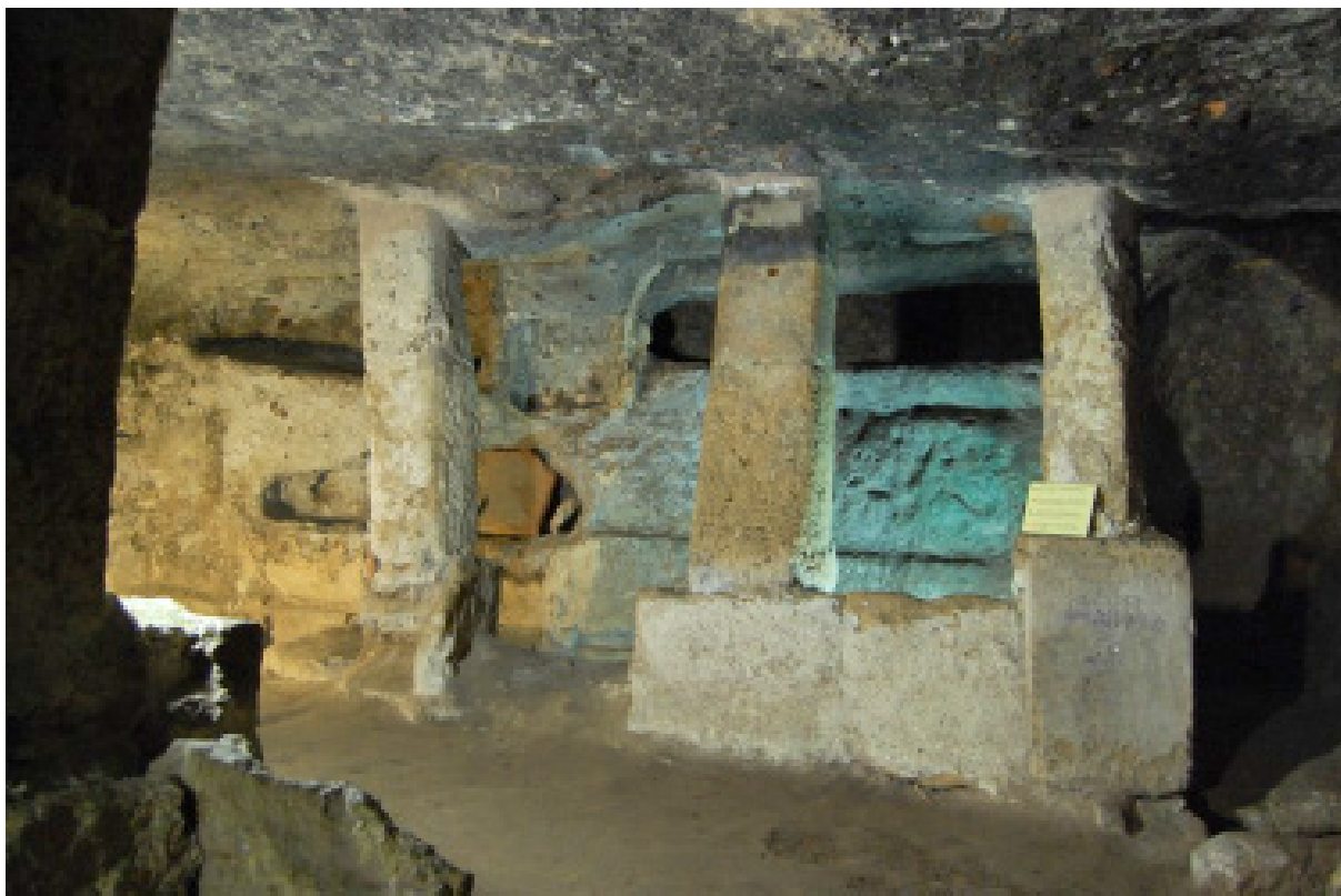
Fig. 3. Sant'Antioco, chiesa di Sant'Antioco, ipogeo G., tomba a baldacchino.