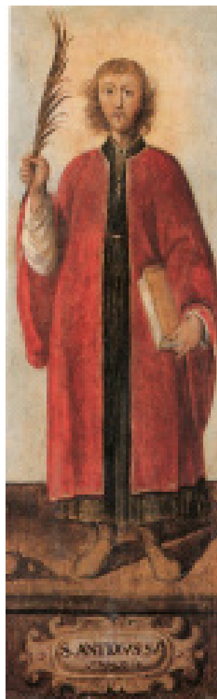
Fig. 12. Oristano, duomo di Santa Maria, Archivietto, elemento di polittico, Sant'Antioco , att. Giovanni Angelo Puxeddu, secondo quarto del XVII secolo, olio su tela, m 1,35 x 0,44 (da Scano 1991, p. 80).