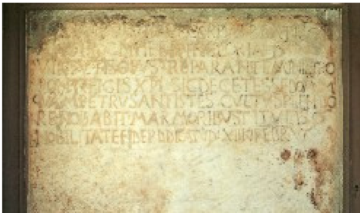
Fig. 1. Iglesias, episcopo, epigrafe del vescovo Pietro (da Pinna 2007, p. 98).