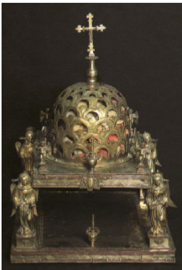
Fig. 17. Sant'Antioco, chiesa di Sant'Antioco, reliquiario , Sisinnio Barrai, 1615, argento dorato (da Murtas 1999, p. 78).