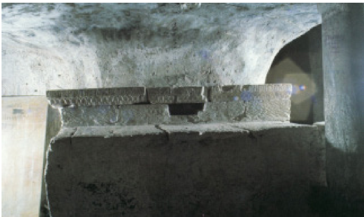
Fig. 4. Sant'Antioco, chiesa di Sant'Antioco, ipogeo, altare-sarcofago (da G. Pinna, Sant'Antioco cit., p. 93).