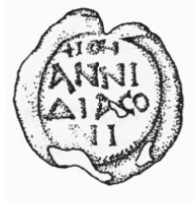
Fig. 7. Oristano, Antiquarium Arborese, sigillo plumbeo, riproduzione grafica , recto (da Spanu & Zucca 2004, p. 124).