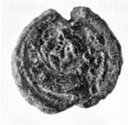
Fig. 5. Oristano, Antiquarium Arborese, sigillo plumbeo, riproduzione grafica , recto (da Spanu & Zucca 2004, p. 124).