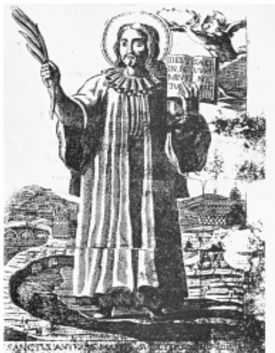
Fig. 11. Sant'Antioco sulcitano, stampa XVII secolo (da Pili 1985, p. 2)