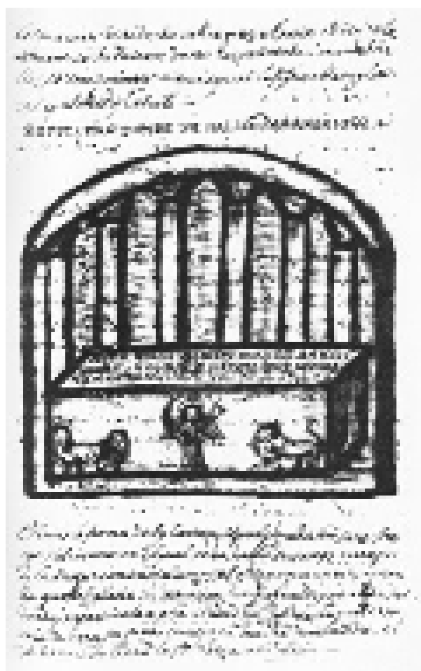
Fig. 2. Sant'Antioco, chiesa di Sant'Antioco, ipogeo G, tomba a baldacchino (foto A. Pala).