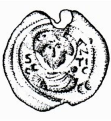
Fig. 6. Oristano, Antiquarium Arborese, sigillo plumbeo, riproduzione grafica (da Spanu & Zucca 2004, p. 124).