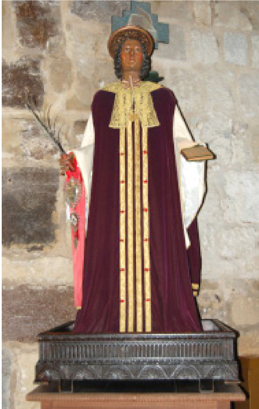
Fig. 18. Sant'Antioco, chiesa di Sant'Antioco, transetto lato sud, Sant'Antioco , Giuseppe Zanda, 1854, legno policromato (foto A. Pala).