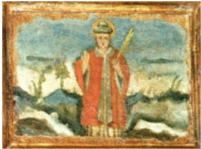
Fig. 9. Tratalias, Chiesa di Santa Maria, trittico dei due San Giovanni, particolare Sant'Antioco , 1596 (da F. Pili, Le meraviglie di S. Antioco cit. , Tav. II).