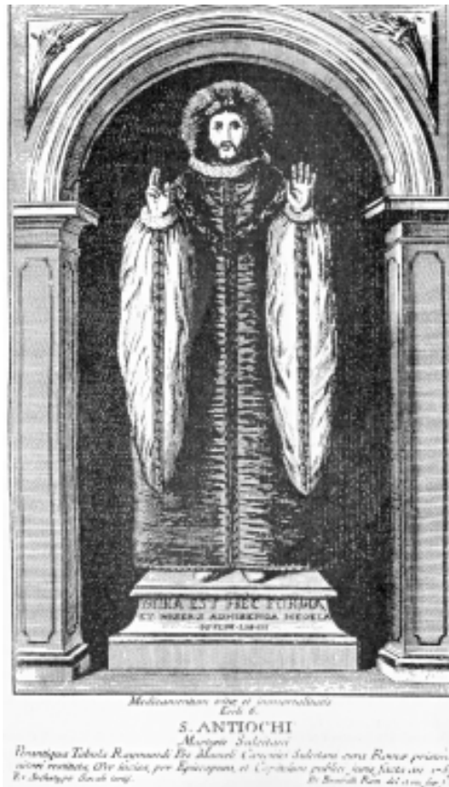
Fig. 14. Cagliari, Collezione Luigi Piloni, Sant'Antioco sulcitano , stampa 1765 (da Lai 2010, p. 72).