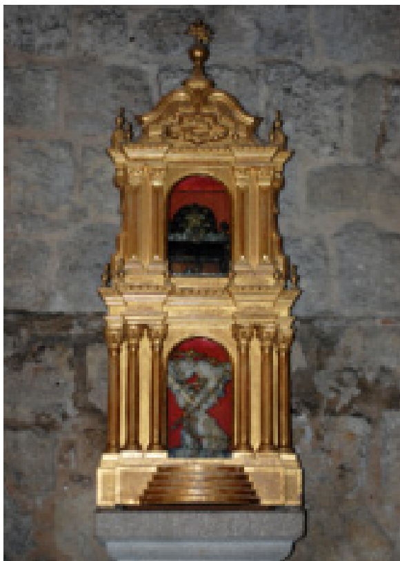
Fig. 16. Sant'Antioco, chiesa di Sant'Antioco, tabernacolo , Efisio Atzeni, 1893, legno dorato.