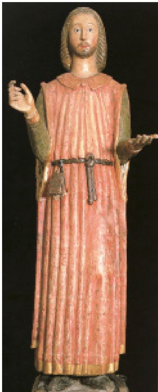
Fig. 10. Ozieri, curia vescovile, Sant'Antioco , legno policromato, m 1,75 (da Scano, 1991, p. 62).