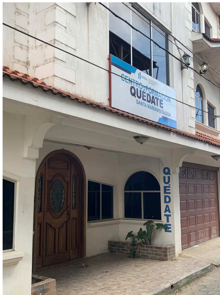
FIG. 2: Santa María's Centro Quédate, Photo by J. Morris.

afford to attend. Ernesto describes the options on offer including hairdressing experience, computer and mechanical repairs, and English language training for work in Guatemala's growing multinational industry of call centres or as tour guides in the nearby popular Lago Atitlán site. The latter call centre and tour guiding options hint at some of the tensions of the programmes. Centres such as that of Quédate are funded to impede the physical mobility of people in the global south. Simultaneously, through their labour, participants support the mobility and economies of local elites and those in the Global North.