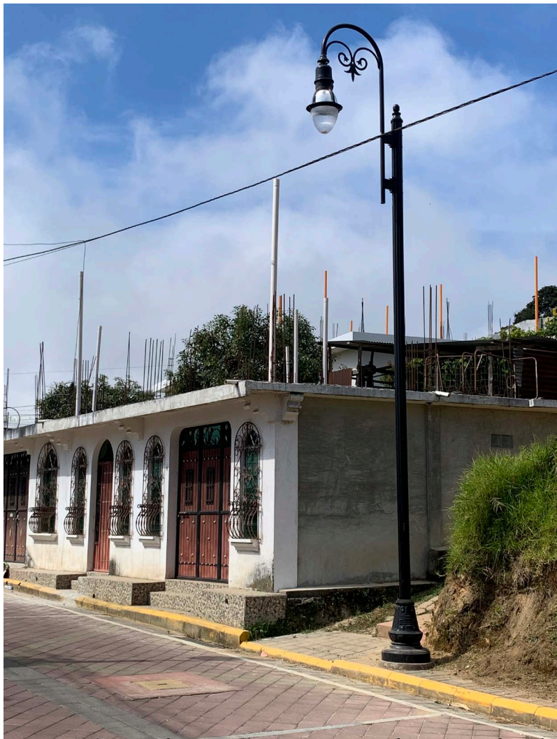
FIG. 1: Arquitectura de Remesas (Remittances Architecture).

weight of fruits, vegetables, and other produce; of the going rate to make it up through Mexico and across the US border. It is a town where migration is an indelible part of daily life – most everyone has attempted the journey or at least considered it. It is towns like Santa María that have garnered the interest of the U.S. Agency for International Development (USAID) and affiliated development agencies in their Root Causes approach. Such programmes include the development of the unabashedly named the Centro Quédate or Stay Here Centre. Centro Quédate operates as a network of training schools across regions in Guatemala where there are high numbers of young people who migrate. This article zooms in on Santa María's Centro Quédate as a clear example of the frontiering through development approach.