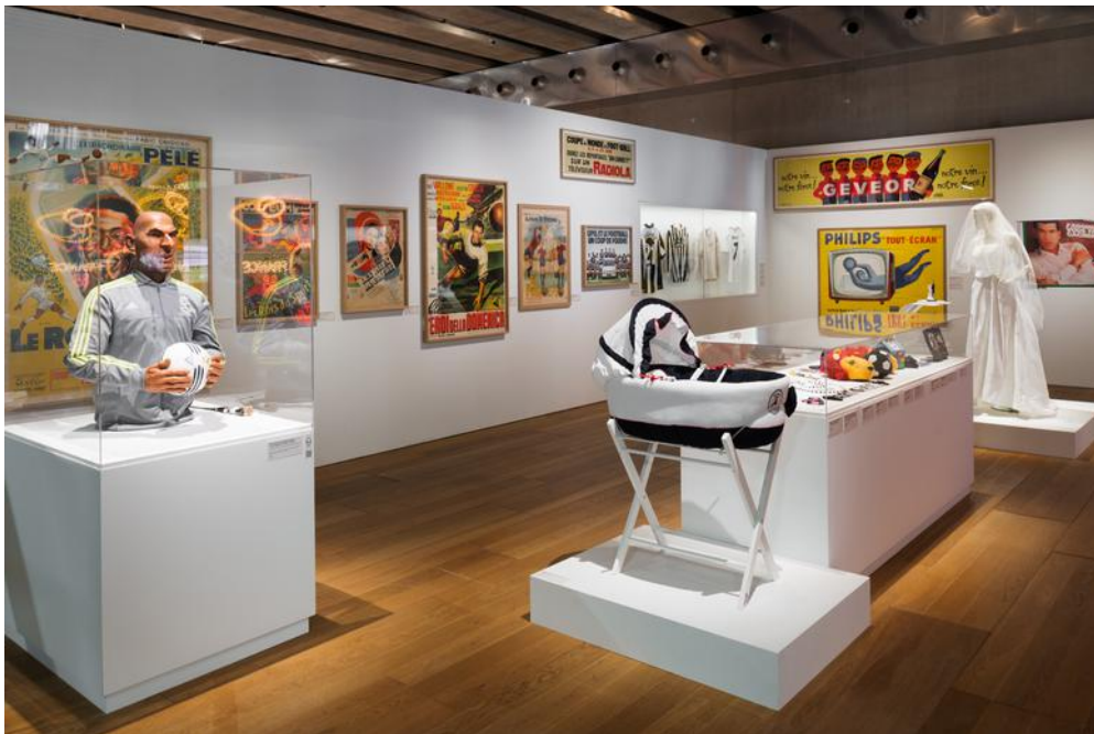
FIG 1: Exposition Nous sommes Foot , MuCEM, Marseille 2017.

Che cosa serve per fare una partita di calcio? Un pallone (di gomma, di pelle, di plastica, di stracci), un campo (in erba, in terra battuta, persino in asfalto), dei compagni di gioco (uno, due, cinque, venti) e poche regole: si gioca con i piedi e lo scopo è tirare il pallone in una rete... anche immaginaria. L'esposizione Nous Sommes Foot , al MuCEM - Musée des Civilisations de l'Europe et de la Méditerranée a Marsiglia dall'11 ottobre 2017 al 4 febbraio 2018 si costruisce attorno a questo format replicabile – e replicato – in tutto il mondo, che al di là della standardizzazione della pratica in termini spaziali e temporali, dell'istituzione di regole, fornisce un quadro di cui questa mostra interroga le variazioni.