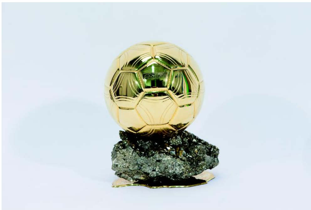
FIG 2: Ballon d'or FIFA, 2007 , Musée National du Sport, Nice.

Europa. In Francia, la prima associazione di questo genere ha visto la luce a Marsiglia nel 1984. A partire dalla fine degli anni Novanta, il movimento prende campo anche in Tunisia, in Marocco, in Libia, in Egitto, in Israele e in Palestina.