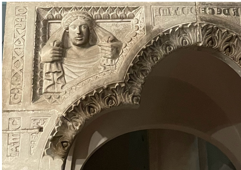
Fig. 12. Teggiano, Cattedrale. Melchiorre, ambone, particolare, Eva , 1271.