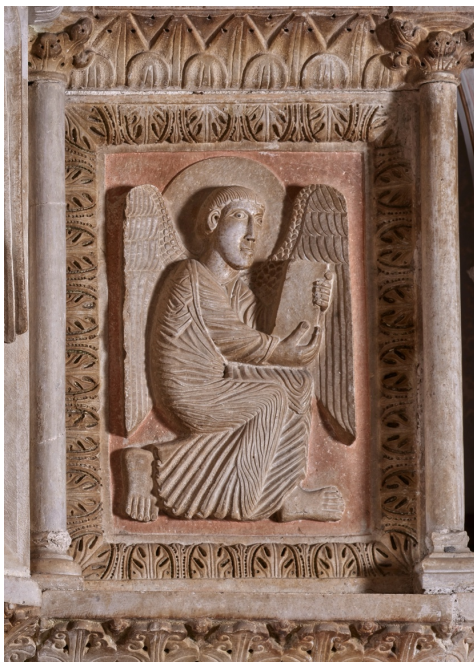
Fig. 5. Teggiano, Cattedrale, ambone, particolare, lastra del parapetto con simbolo dell'Evangelista Matteo.

metà dei beni immobili della chiesa per nove once d'oro 29 . Con il ricavato venne promosso un restauro, nel quale si dovette sentire l'esigenza di aggiornare l'edificio a soluzioni moderne. In questa contingenza intervenne Melchiorre, magister itinerante ed esponente di una generazione che seppe reinterpretare, nella seconda metà del Duecento, le esperienze artistiche proprie della "cerchia federiciana" formatasi nei cantieri imperiali del Regnum 30 . Ciò che emerge dall'indagine analitica di alcune componenti dell'ambone, in primis quella sulle lastre raffiguranti gli evangelisti, è una prassi volta al riuso di alcuni elementi scultorei già esistenti e coerentemente integrati nella struttura. Le due lastre con l'angelo sul lato sud (fig. 5) e il toro sul lato ovest (fig. 6) sono leggermente più alte delle altre, oltre a presentare una cornice a foglia con l'andamento più serrato.