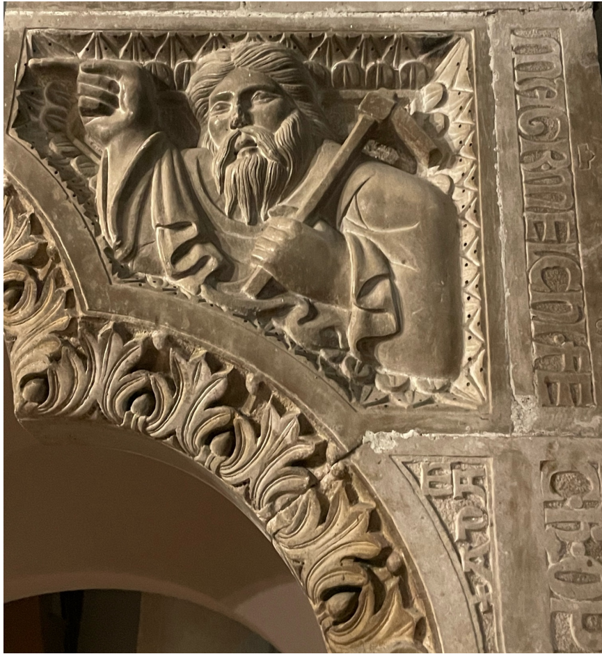
Fig. 11. Teggiano, Cattedrale. Melchiorre, ambone, particolare, Adamo , 1271.