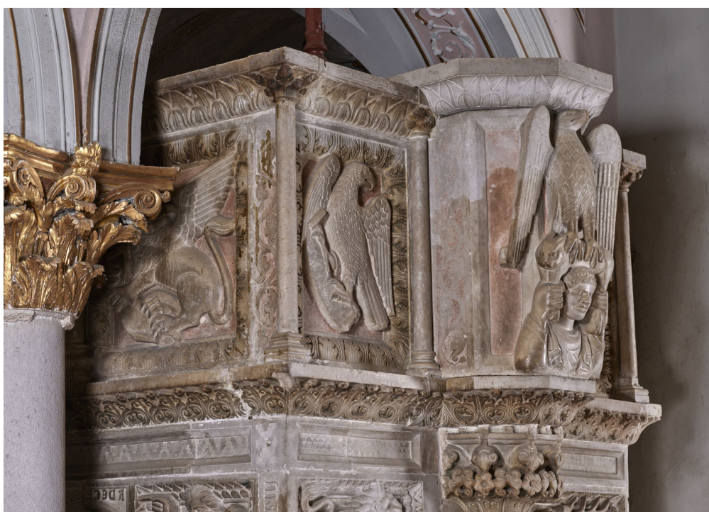
Fig. 4. Teggiano, Cattedrale, ambone , particolare.

All'esame delle murature interne, inoltre, risulta chiaro che l'intera struttura del lettorino è stata incassata a posteriori sul parapetto. Alle parti ottocentesche presenti nell'attuale configurazione del pulpito potrebbe appartenere anche la lastra con il leone alato, simbolo di Marco, collocata verso est, in prossimità della scala di ingresso, su cui tornerà in seguito.