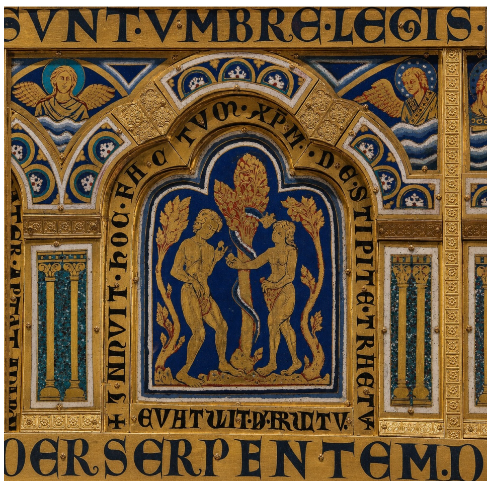
Fig. 14. Klosterneuburg, Abbazia, Cappella Leopoldina, Altare di Verdun, particolare, Tentazione di Adamo ed Eva , 1331.

volto femminile 43 (fig. 14). In verità, quest'opera aveva in origine la funzione di rivestimento di un pulpito all'interno della chiesa abbaziale. Quando, nel 1330, un incendio compromise il manufatto, le tavole furono salvate e riorganizzate in una pala d'altare. In quella circostanza vennero commissionati sei nuovi smalti, fra cui quello con l'immagine della Tentazione, databile quindi al 1331 44 . Ciò sta a confermare come la sovrapposizione fra Eva e il serpente inizi a farsi spazio a cronologie più avanzate rispetto al caso di Teggiano. Si noti, inoltre, che, durante la fase della trasformazione in polittico del manufatto, si sia deciso di collocare in asse il nome di Eva nell'epigrafe alla base della placchetta con quello del serpente menzionato nell'iscrizione continua che corre immediatamente al di sotto, quest'ultima datata 1181 45 .