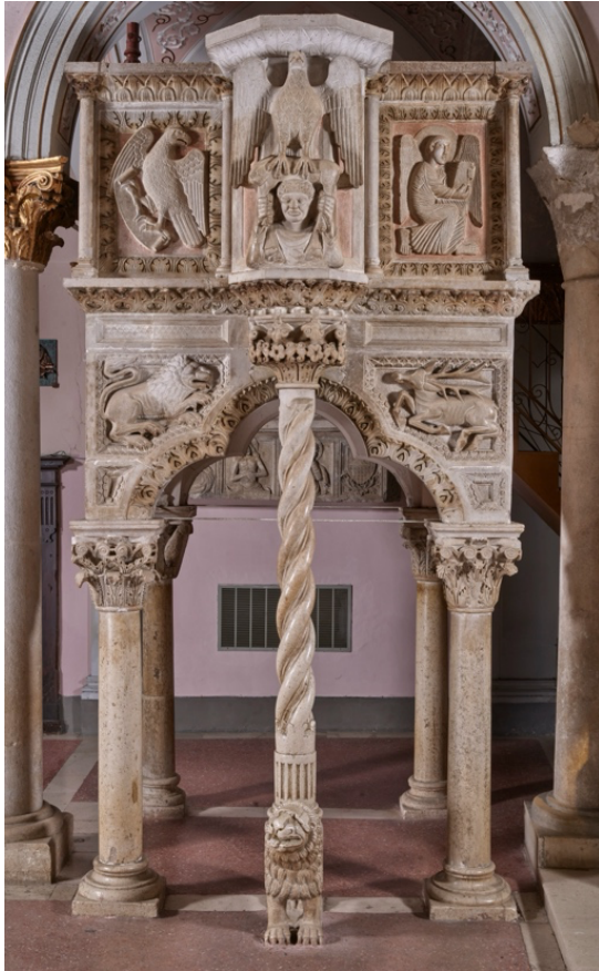
Fig. 1a. Teggiano, Cattedrale. Melchiorre, ambone, lato sud, 1271.

di un raffinatissimo capitello a cesta di fiori, poggia sul dorso di un leone stiloforo e fa da sostegno al lettorino 7 . Il lato sud e il lato ovest del manufatto sono quelli che conservano quasi interamente l'originaria decorazione di età medievale, mentre il lato nord e quello est risentono maggiormente di aggiunte moderne e integrazioni in stucco.