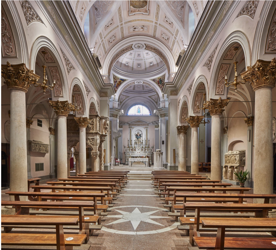
Fig. 3. Teggiano, Cattedrale, interno , stato attuale (Bibliotheca Hertziana – Istituto Max Planck per la storia dell'arte, fotografo Enrico Fontolan).

setto e coro a terminazione rettilinea: questo assetto risente soprattutto della ricostruzione ex novo che si decise di intraprendere dopo che il terremoto del 1857 ne compromise definitivamente l'aspetto originario 17 (fig. 3).