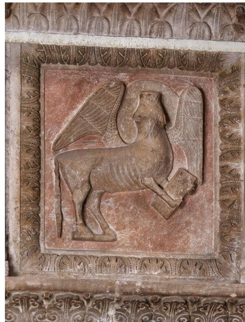
Fig. 6. Teggiano, Cattedrale, ambone, particolare, lastra del parapetto con simbolo dell'Evangelista Luca.