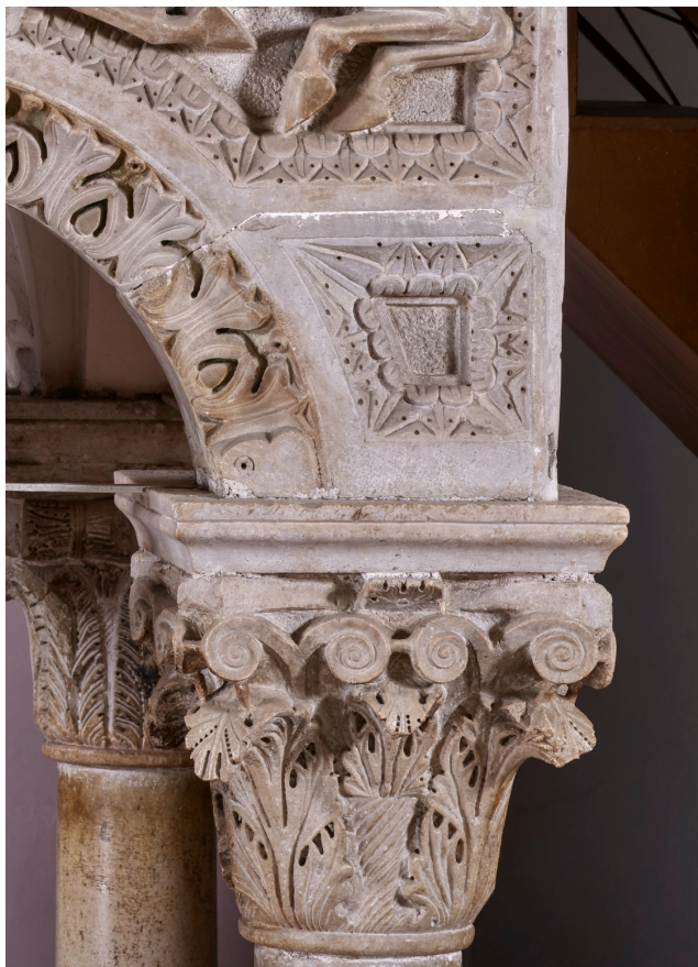
Fig. 9. Teggiano, Cattedrale. Melchiorre, ambone, particolare , 1271.

in molte campiture di fondo, di uno strato non lavorato lascia infatti ipotizzare che queste ultime potessero ospitare materiale di riempimento, molto probabilmente mastice (fig. 9), oggi del tutto perduto. Ciò è desumibile anche dall'osservazione del lato ospitante l'epigrafe, che doveva apparire ben più visibile, grazie all'effetto a contrasto generato dal rivestimento. In tal senso, il caso di Teggiano può essere messo in relazione ad altri casi di arredi liturgici meridionali che prevedono l'impiego della medesima tecnica 32 .