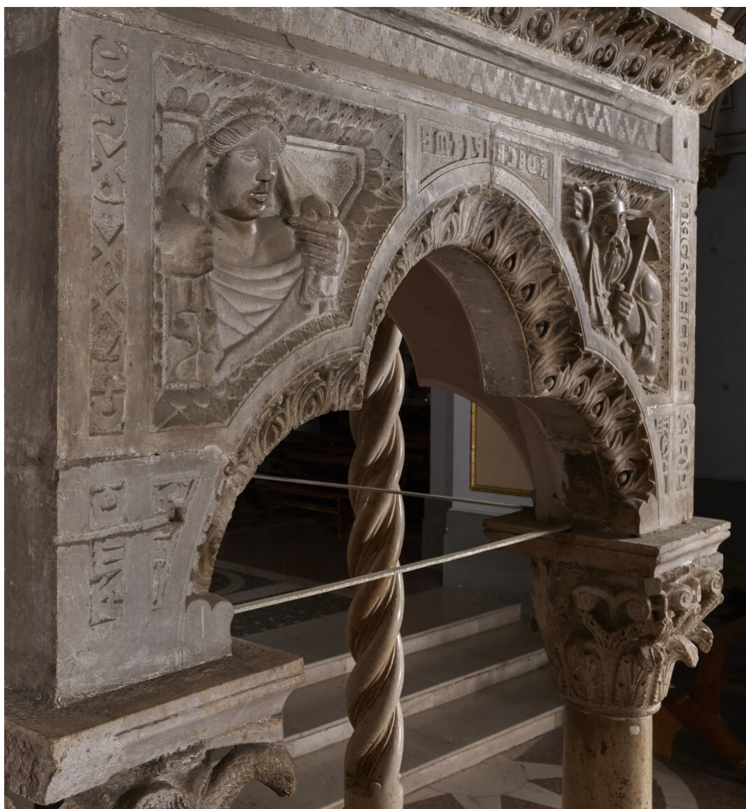
Fig. 13. Teggiano, Cattedrale. Melchiorre, ambone, particolare, arco trilobato sul lato ovest, 1271.

La visualizzazione dell’oralità attraverso la relazione fra parola scritta e immagine – riconducibile alla tipologia del “fumetto medievale” 37 – è abbastanza diffusa in esempi più tardi, costituiti soprattutto da casi di pittura del XIV secolo 38 , mentre è di fatto non