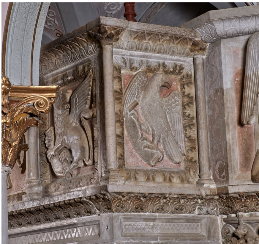
Fig. 7. Teggiano, Cattedrale. Melchiorre, ambone, particolare, lastre del parapetto con i simboli degli Evangelisti Marco e Giovanni , 1271 (Bibliotheca Hertziana – Istituto Max Planck per la storia dell’arte, fotografo Enrico Fontolan).

Queste figure sono accomunate dalla resa delle ali – rigidamente stilizzate – e dalla loro rigorosa disposizione entro lo spazio dell’incorniciatura. D’altra parte, il leone del lato ovest e l’aquila del lato sud esprimono uno stile di marca ben diversa: la loro forza plastica, riconducibile all’aggiornato contesto artistico federiciano, fa sì che esse si dispongano dinamicamente nello spazio, arrivando addirittura a fuoriuscire dal limite imposto dalla cornice (fig. 7).