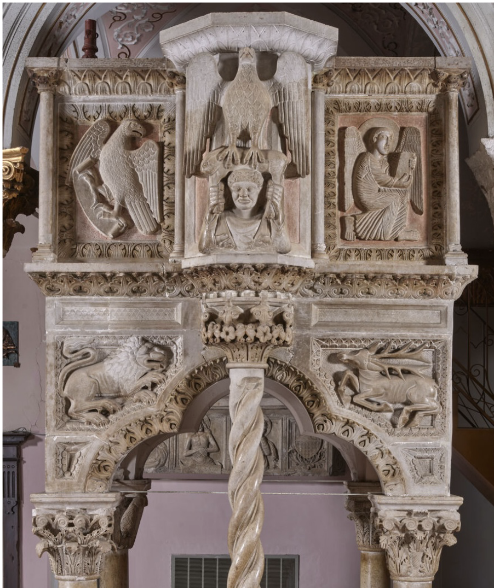
Fig. 16. Teggiano, Cattedrale. Melchiorre, ambone, particolare, gruppo reggi leggio , 1271 (Bibliotheca Hertziana – Istituto Max Planck per la storia dell'arte, fotografo Enrico Fontolan).

Del resto, la colpa commessa da Eva trova fra le sue dirette conseguenze l'insorgere del desiderio sessuale, "il moto voluttuoso" che non è "naturale", cioè creato insieme all'uomo, ma conseguenza dell'atto proibito, entrato nella storia umana per punire la prima grande disubbidienza. Peccato, mortalità e desiderio sessuale sono legati da un rapporto assai stretto già a partire dagli scritti di Agostino e questi temi si concretizzano nella vicenda di Adamo ed Eva, intesa come catastrofe da cui ha avuto inizio la Storia umana 52 .