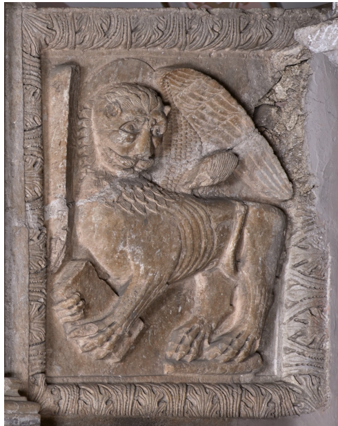
Fig. 8. Teggiano, Cattedrale, ambone, particolare, lastra del parapetto con simbolo dell'Evangelista Marco.

Rimane di difficile interpretazione l'ultima lastra, presente sul lato est del parapetto, che ripropone, per la seconda volta, l'immagine dell'evangelista Marco (fig. 8). La duplicazione dell'immagine del leone potrebbe essere spiegabile, ancora una volta, nell'ottica di un reimpiego: sul piano iconografico, questa lastra andrebbe infatti ricollegata alla prima campagna di lavoro.