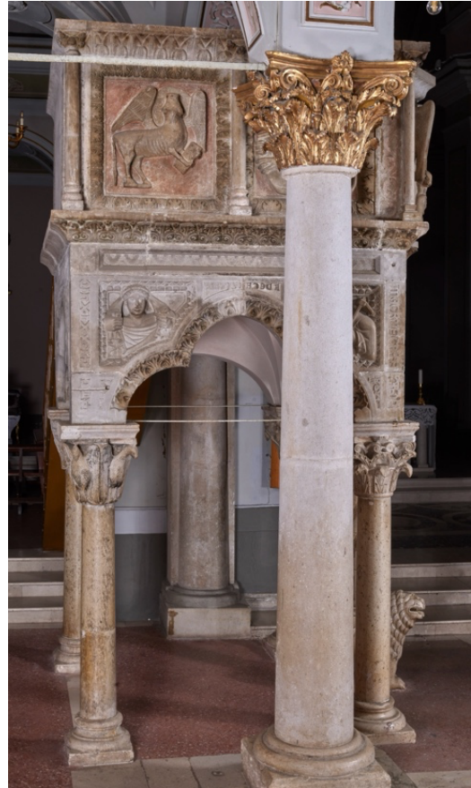
Fig. 1b. Teggiano, Cattedrale. Melchiorre, ambone, lato ovest, 1271.

Gli archetti trilobati presentano altorilievi con l'immagine dei Progenitori (lato ovest) e di un leone e un cervo affrontati (lato sud), mentre il parapetto è ornato da diverse lastre raffiguranti i simboli dei quattro evangelisti, separate fra di loro da una serie di