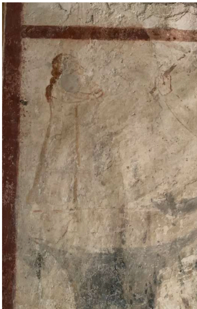
Fig. 12. Silanus, chiesa di San Lorenzo, pitture della parete meridionale, particolare della "scena con incudine".

di Milano che raffigurano le Storie di Sant'Eligio di Niccolò da Varallo (1425/1490). Questo racconto agiografico potrebbe spiegare la presenza della figura femminile in alto a sinistra presente a San Lorenzo (fig. 12).