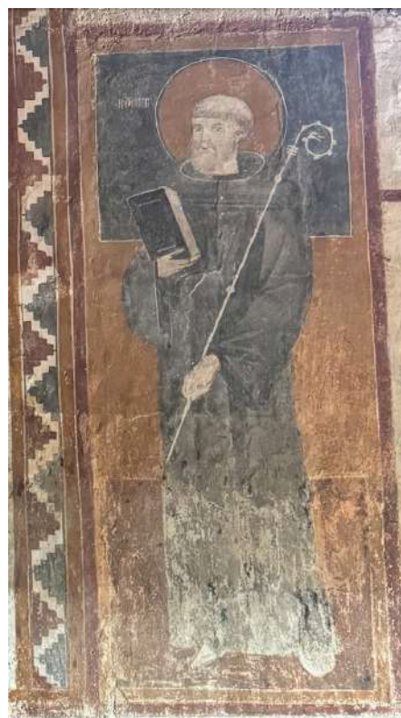
Fig. 10. Silanus, chiesa di San Lorenzo, pittura della parete meridionale, San Benedetto.

Il primo, con aureola e mitra sul capo, tiene il pastorale con la mano destra e il libro chiuso nella sinistra 78 . Sembrerebbe potersi riconoscere nel copricapo del vescovo tau-maturgo la tipologia di mitria simplex o bianca decorata con galloni dorati sul bordo inferiore e al centro 79 . San Biagio indossa una veste chiara sulle tinte del verde e una