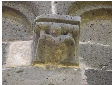
Fig. 6. Silanus, chiesa di San Lorenzo, decorazione scultorea con figura umana

La cornice, posizionata immediatamente sotto le falde del tetto mostra una decorazione a foglie lanceolate tempestate di perline che si dispone lungo il perimetro dell'edificio in maniera discontinua (fig. 7).