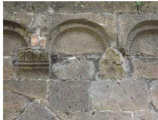
Fig. 3. Silanus, chiesa di San Lorenzo, peducci della facciata, decorazione vegetale e geometrica

architravato e con arco di scarico a sesto acuto 26 . Quest'ultimo elemento è tra quelli che,