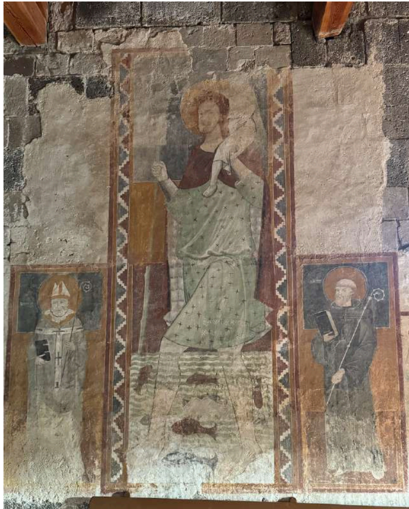
Fig. 8. Silanus, chiesa di San Lorenzo, parete meridionale, dipinto su parete con San Cristoforo tra i santi Biagio e Benedetto.

Nella figura centrale, di maggiori dimensioni, sembra potersi riconoscere San Cristoforo (fig. 8). La rappresentazione, infatti, riprende i principali attributi iconografici del santo, non solo le marcate dimensioni ma anche il bastone che tiene con la mano destra e il bambino sfortunatamente ormai acefalo che porta sulle spalle 75 . Il santo è rappresentato con le gambe immerse nel fiume, nel quale nuotano svariati pesci, mentre il resto dello sfondo è scompartito secondo tre bande di diversa colorazione. San Cristoforo indossa una veste verde chiara con piccole croci ed un manto rosso foderato di vaio, secondo l'interpretazione proposta di recente da Nicoletta Usai 76 .