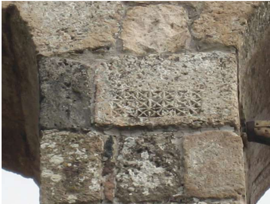
Fig. 14. Silanus, chiesa di San Lorenzo, decorazioni scultorea nel paramento esterno.

dimensioni nettamente maggiori. La stessa studiosa ha avanzato l'ipotesi che possa trattarsi di Maria Maddalena penitente o di Maria Egiziaca 92 . La lettura può essere condivisa se si prende in considerazione la leggenda di vita di quest'ultima secondo la quale un monaco, nel deserto, le avrebbe portato sia nutrimenti che vesti per coprirsi, elementi che possono essere riconosciuti tra le mani del personaggio vestito di rosso. Quest'ultima immagine presenta vari aspetti problematici dati da una serie di superfetazioni grafiche che lasciano intravedere nella parte alta un piccolo volto umano e poco sotto la metà del riquadro una sorta di cornice a nido d'ape, apparentemente fuori contesto. Quest'ultima presenta delle assonanze sia con i brani pittorici di età medievale conservati nella chiesa di Sant'Antonio Abate a Orosei 93 , sia con un elemento decorativo scolpito in uno dei conci del paramento murario della stessa San Lorenzo (fig. 14).