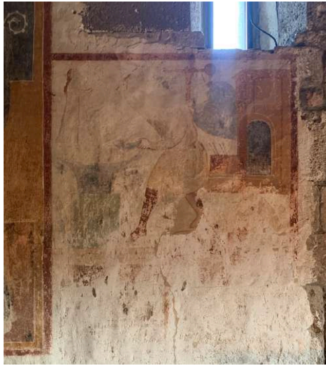
Fig. 11. Silanus, chiesa di San Lorenzo, pitture della parete meridionale, scena narrativa di un uomo che batte sull'incudine (foto dell'A.).

A completare la decorazione una scena pseudo narrativa nella quale si intravedono una figura acefala al centro con un maglio che batte su un'incudine (fig. 11) 83 .