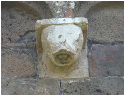
Fig. 2. Silanus, chiesa di San Lorenzo, peducci della facciata, protome animale

Il resto della decorazione ripropone elementi vegetali e geometrici non nuovi al repertorio isolano come la doppia foglia ricurva o la modanatura a dentelli (fig. 3). In particolare, quest'ultimo motivo decorativo è simile a quello che ritroviamo a Santa Maria di Corte a Sindia, prima fondazione isolana dei monaci cistercensi 25 .