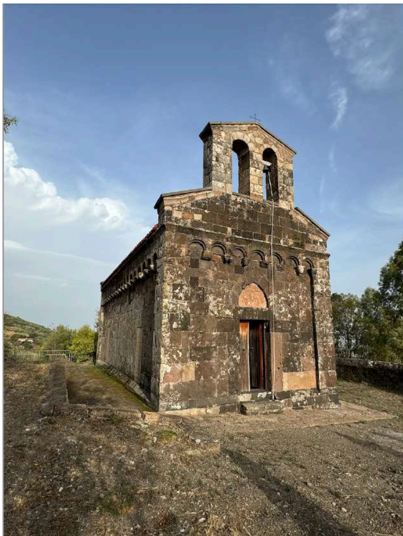
Fig. 1. Silanus, chiesa di San Lorenzo (foto dell'A.).

sacrestia, nel 1317 8 . Il nome del martire compare anche tra i santi patroni titolari di alcune cappelle delle grange francesi, in particolare quella di Crecy e di Champigny quest'ultima appartenente all'abbazia di Clairvaux 9 . La stessa, dalla documentazione superstita, risulta essere l'abbazia madre di tutte le fondazioni isolane 10 .