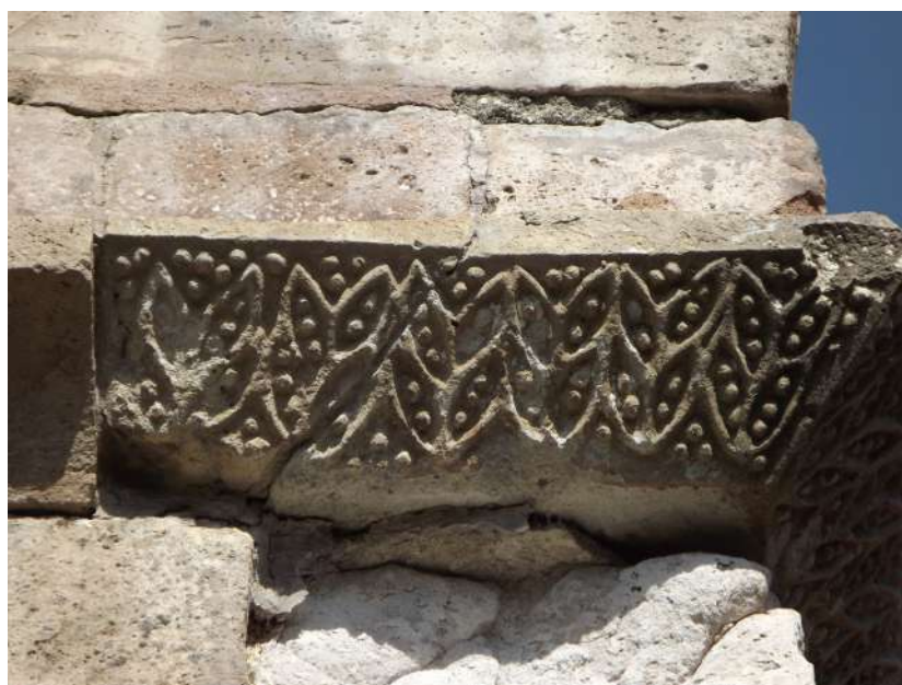
Fig. 7. Silanus, chiesa di San Lorenzo, decorazioni scultoree con elementi vegetali

Il primo a darne notizia fu Wart Arslan 32 . Successivamente Raffaello Delogu propose di riconoscere nell'elemento decorativo una certa somiglianza con ornamenti presenti nella chiesa di Santa Chiara a Iglesias 33 . Questo tipo di lettura aveva portato lo studioso a considerarli "spuri" e frutto di interpolazioni per restauro 34 oltre che evidentemente attribuirgli una cronologia postuma rispetto alla fase di fondazione della chiesa 35 . L'aspetto iconografico di questi elementi decorativi è abbastanza interessante soprattutto se messo in relazione con una presenza cistercense. L'ordine monastico di matrice francese, infatti, almeno nel suo primo periodo di espansione, è noto per un limitato interesse nei confronti della decorazione dei propri luoghi di culto 36 . Una prassi consolidata, della quale si può trovare riscontro nella Charta Caritatis ma la cui applicazione rigida inizierà a venire meno già nei primi decenni del XIII secolo 37 .