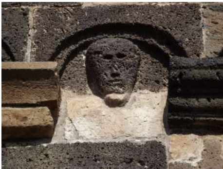
Fig. 5. Silanus, chiesa di San Lorenzo, decorazioni scultorea con viso umano

La teoria di archetti presenti in facciata è riproposta anche sui paramenti laterali della chiesa riprendendo le medesime forme e decorazioni dei peducci, anche in questo caso di marcata ispirazione vegetale e geometrica. L'elemento antropico è presente in uno degli archetti, si tratta di un volto umano sommariamente tratteggiato con occhi naso e bocca che sulla base di una semplice analisi autoptica non è possibile definire ulteriormente (fig. 5). Anche in questo caso, abbiamo esemplari simili in altri edifici religiosi coevi 30 . Sul lato settentrionale sono ancora ben visibili due accessi alla struttura ormai tamponati. La zona absidale anch'essa delimitata da paraste d'angolo poggianti su uno zoccolo ampio, presenta la medesima decorazione ad archetti. I peducci in questa porzione muraria risultano quasi tutti lisci eccetto uno che ripropone quelli che sembrano essere i tratti di una figura umana di piccole dimensioni (fig. 6) 31 .