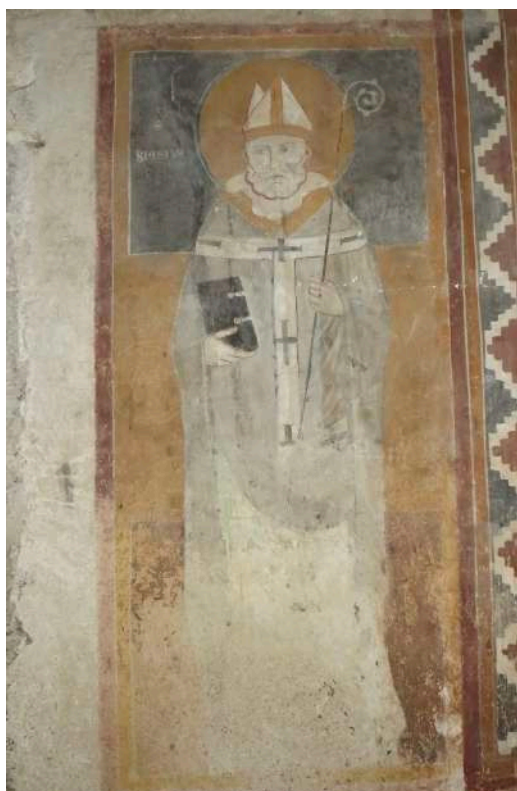
Fig. 9. Silanus, chiesa di San Lorenzo, pittura della parete meridionale, San Biagio.

Ai lati, posizionati in basso rispetto a San Cristoforo, si trovano due effigi quasi simmetriche sia nella posizione delle figure che nei colori. Si tratta di due personaggi inseriti su uno sfondo a tre bande colorate in rosso, giallo e blu del tutto simile a quello precedente. La correlazione tra i vari attributi iconografici, ma soprattutto la presenza di un titulus accanto ai due personaggi, ci consente di individuarli rispettivamente come San Biagio e San Benedetto (figg. 9-10).