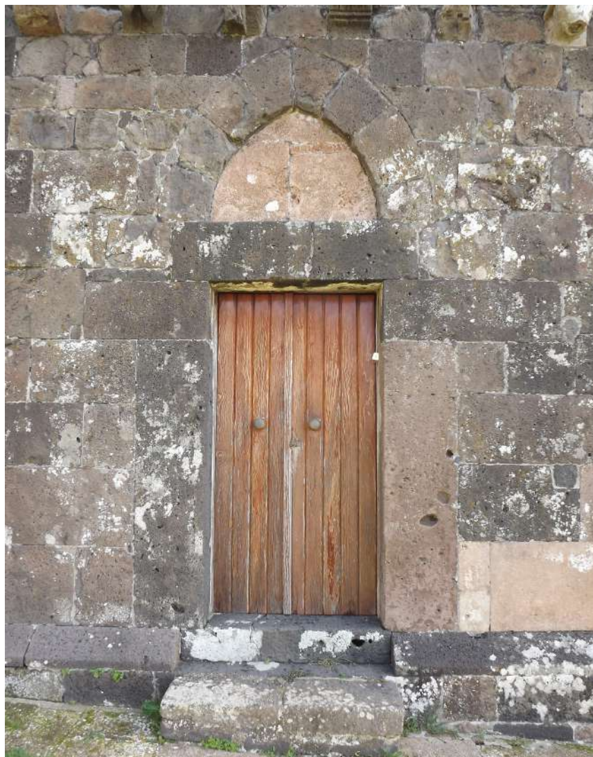
Fig. 4 Silanus, chiesa di San Lorenzo, portale d'ingresso con lunetta a sesto acuto (foto dell'A.)

negli anni, hanno contribuito a supportare l'ipotesi che la chiesa di San Lorenzo fosse stata costruita da maestranze cistercensi (fig. 4).