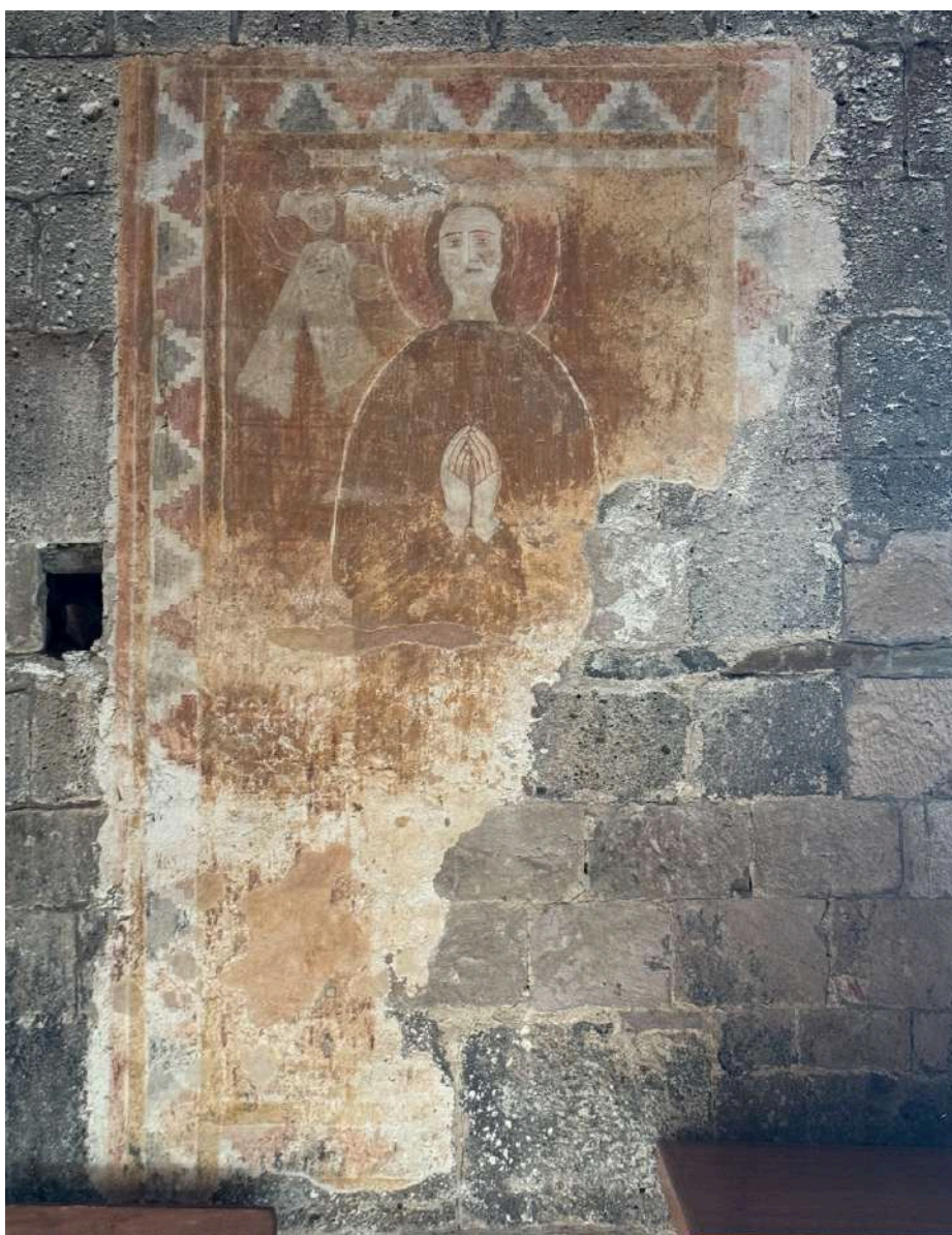
Fig. 13. Silanus, chiesa di San Lorenzo, pitture della parete meridionale, figura di Santa.

Rappresentata a figura intera, quella che recentemente è stata interpretata come una donna non mostra alcun segno che possa alludere alle forme del corpo 91 . Nell'angolo in alto a sinistra, quasi all'incrocio tra la cornice orizzontale superiore e quella verticale sinistra, si intravede una ulteriore figura. Secondo la proposta di Nicoletta Usai, si tratterebbe di un essere umano vestito di rosso scuro con le mani velate che tiene in mano un'ostia o del pane di forma circolare; l'uomo scende verso la santa rappresentata in