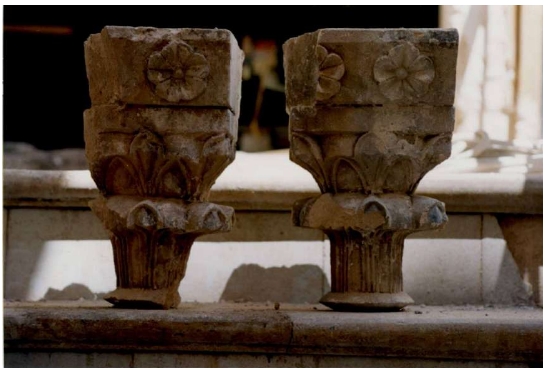
Fig. 1. Capiteles de finestra coronella , C/ de la Concepció, 13 (desaparecido. Foto: Josep Morata).

Los capiteles de coronella , acorde a su morfología y ornamentación, pertenecían a dos tipos genuinos del siglo XIV 9 . El primero caracterizado por el motivo de las hojas de lirio dispuestas en dos pisos (nº de ficha 10 0100 y 0190 11 ) (fig. 1); el segundo definido por hojas de cardo que parten de los ángulos y se extienden a las cuatro caras del tambor (nº de ficha 0197) (fig. 2).