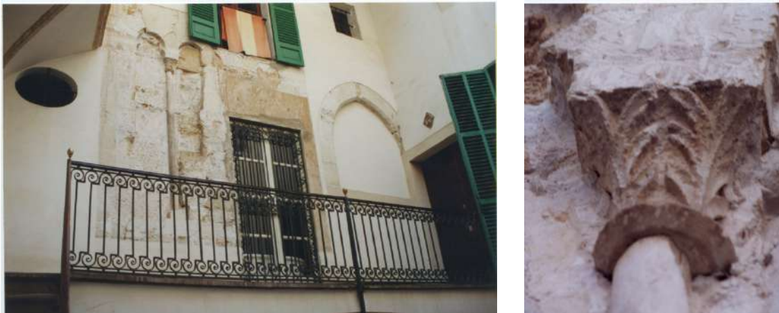
Fig. 2. Finestra coronella y su capitel, C/ de l'Estanc 4 (desaparecido. Foto: Josep Morata).