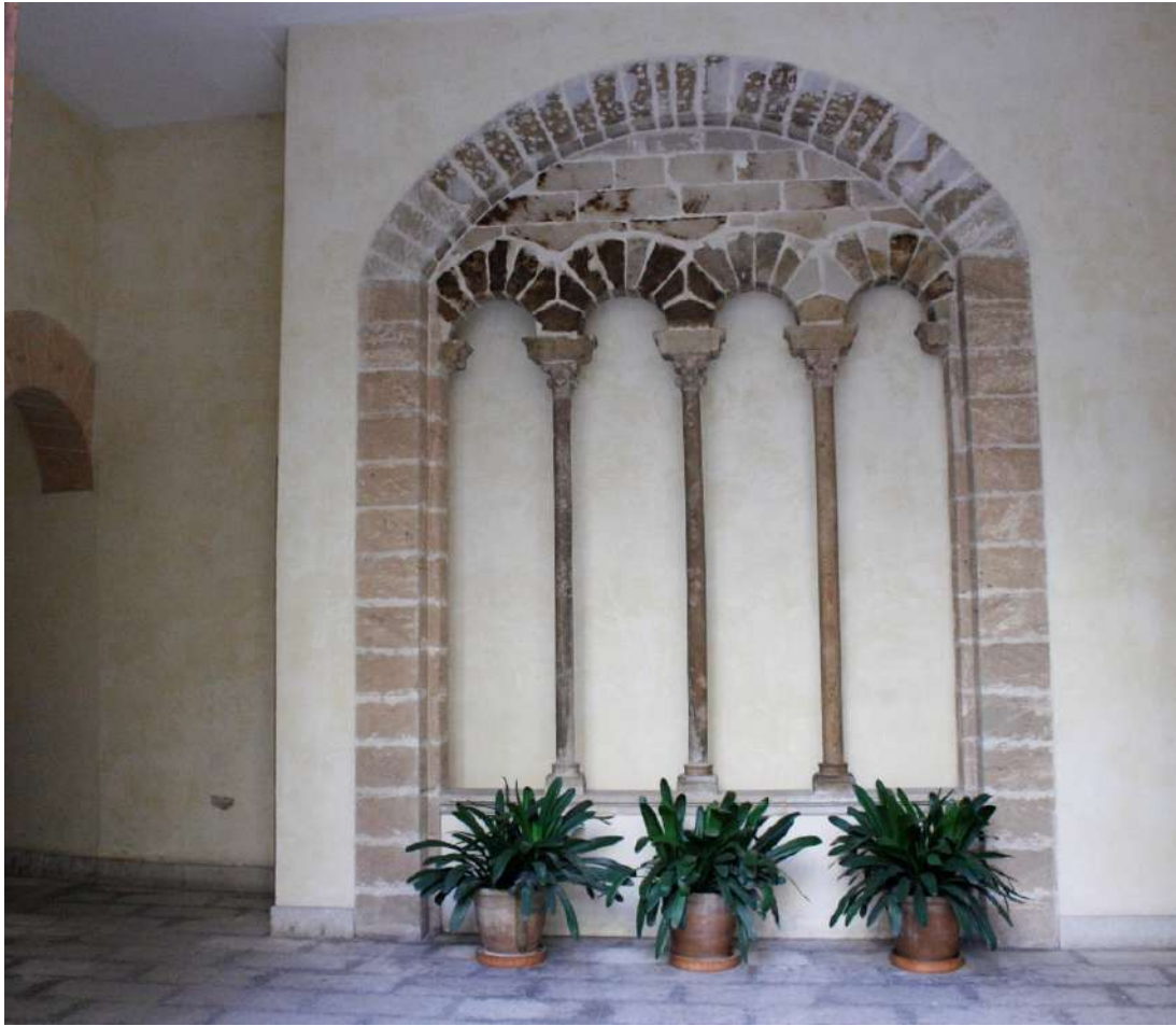
Fig. 8. Finestra coronella, C/ de Sant Jaume 7.

Finalmente, en ocasiones nos encontramos con fragmentos que fueron recuperados en fechas indeterminadas de lugares no consignados, pasando a formar parte de colecciones particulares, como la de Son Berga (Establiments). En esta finca privada se conservan partes de portales y de ventanas procedentes de Can Muntanyans y de Can Valentí Ses Torres (nº de ficha 0502), cuyo origen se ha colegido de la heráldica y emblemas que ostentan.