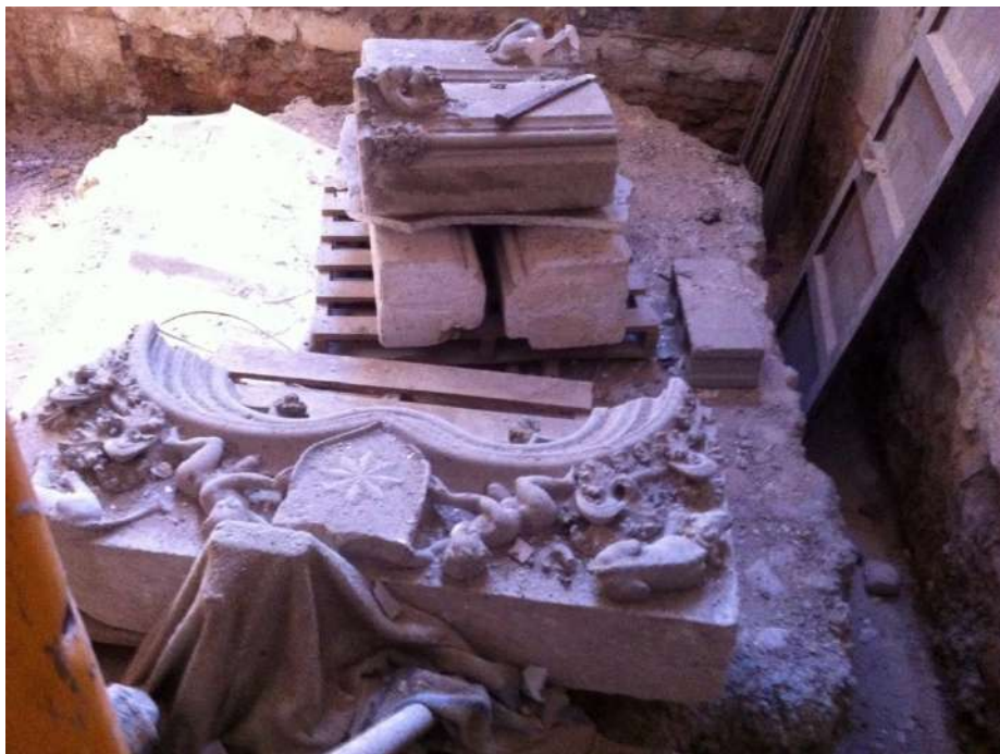
Fig. 5. Fragmentos de portal d'estudi , C/ de Can Danús 6.