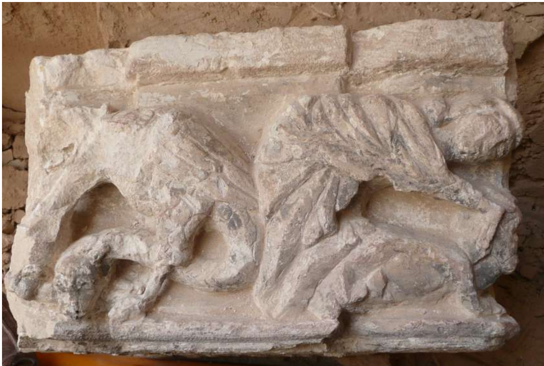
Fig. 4. Detalle del capitel, C/ de Can Tamorer 1.

Cuando se estaba realizando el trabajo de campo para el proyecto de investigación sobre la casa medieval fueron descubiertos de manera fortuita, al atisbar desde la calle el interior de un edificio en obras, los fragmentos inéditos de un portal d'estudi (portal