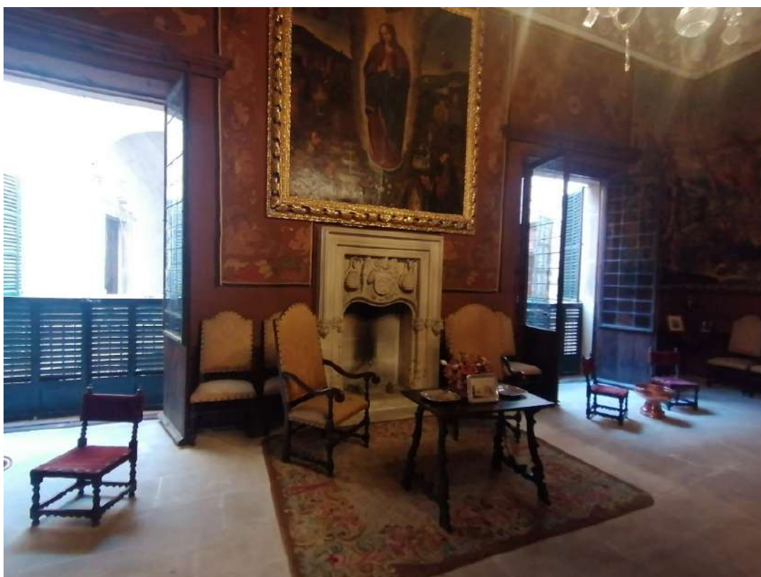
Fig. 7. Sala de música de Can Vivot.

a la nobleza local– desde mediados del siglo XV. Sin embargo, en fecha desconocida se trasladó al lugar que actualmente ocupa: Can Vivot. Así se denomina el palacio de época barroca que los condes de Zavellá poseían en el centro histórico de la capital, cuya fábrica actual pertenece en buena medida a una reforma del siglo XVIII, y que desde abril de 2022 es accesible gracias a su reconversión en casa-museo. El portal d'estudi ahora luce en la planta noble, emmarcando la chimenea dispuesta en el centro de la llamada sala de música (fig. 7). Este nuevo emplazamiento y sobre todo el cambio de uso que implicó, conllevaron la mutilación del elemento patrimonial, que vio seccionadas sus jambas para que el conjunto se pudiese ajustar como frontal del hogar.