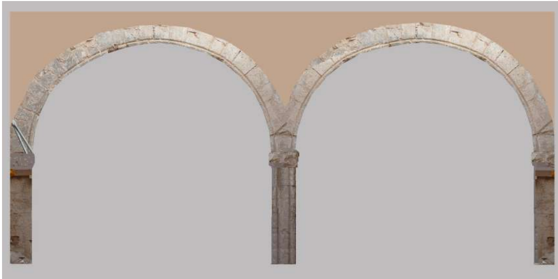
Fig. 3. Arcos geminados de patio, C/ de Can Tamorer 1 (reconstrucción: © Josep Morata).

cuando se reformaba el inmueble. Ahora, la catalogación digital ha permitido, se ha conseguido ponerla en valor y darla a conocer a la comunidad científica.