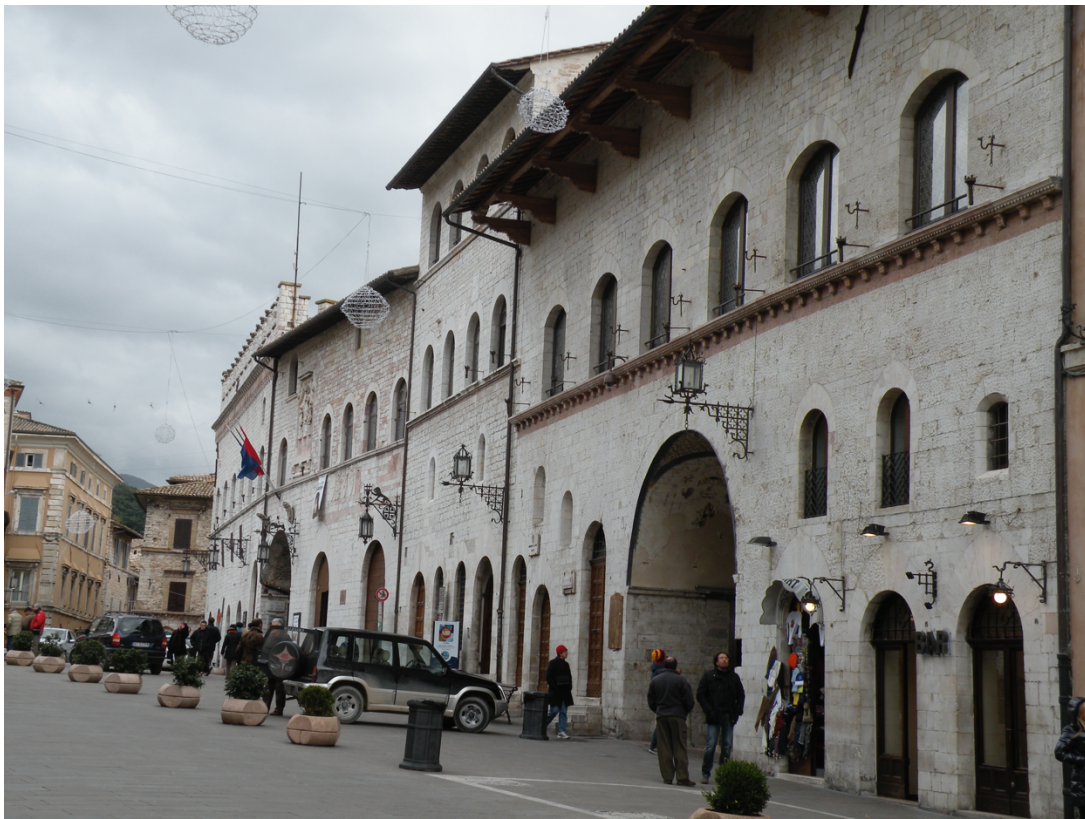
Fig. 3. Assisi, Palazzo del Governatore (C), prospetto su piazza del Comune (foto A. ottobre 2022).

Il nucleo più antico del complesso (A 1 , A 2 ) dovrebbe identificarsi con l'edificio che include il cosiddetto Arco dei Priori, acquistato dal comune nel 1275 (fig. 4). In origine di proprietà privata, il «Palatium domini Vagnoni», «ante palatium novum comunis assisi e in domo olim d. Vagnutii et nunc comunis Asisii» 16 , inglobava una «via que itur ad Episcopatum» 17 . A una prima analisi si era pensato che si potesse trattare di due corpi di fabbrica differenti, uniti dalla presenza del passaggio voltato. Il primo (A 2 ) a oriente sembrava il frutto di un progetto unitario, in considerazione dell'uniformità delle aperture al piano terreno e il coronamento con archetti trilobati 18 (fig. 2). Il secondo a occidente (A 1 ) è stato oggetto di numerose manomissioni, forse dovute a terremoti, che hanno portato l'inserimento di conci di pietra dal colore rosato nel livello superiore; la dimensione e la forma delle aperture si distinguono dal corpo adiacente 19 .