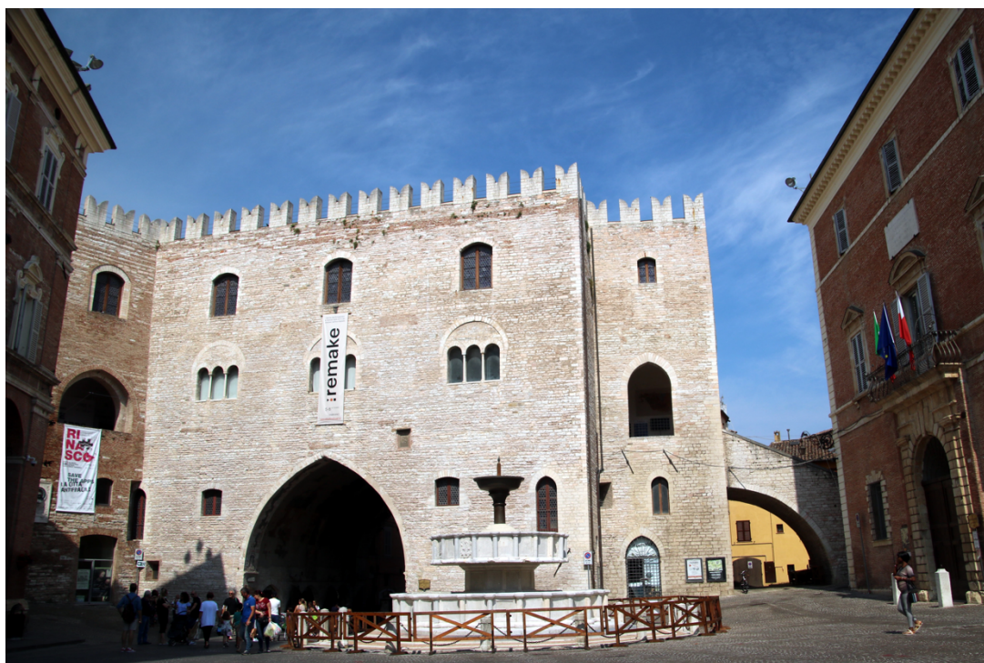
Fig. 5. Fabriano, palazzo del Podestà (Fonte: Wikimedia Commons CC BY-SA 4.0 ( https://commons.wikimedia.org/wiki/File:Palazzo_del_Podest%C3%A0_%28Fabriano%29_04.jpg )).

Il palacium è costituito da un corpo di fabbrica centrale e due laterali, rimaneggiate successivamente 40 . Quello centrale presenta tre livelli: tre trifore, ripristinate in fase di restauro, illuminano il piano nobile. L'elemento più interessante è la volta a sesto acuto posta in mezzeria, che domina il prospetto del palazzo verso la piazza 41 . Quest'ultima sormonta la strada che originariamente metteva in collegamento la piazza del Mercato – oggi piazza Garibaldi – con la piazza del Comune divenuta il centro stabile dell'amministrazione della città, in seguito alla costruzione del palazzo podestarile.