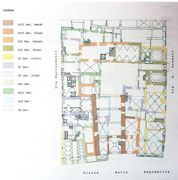
Fig. 7. Foligno, Palazzo del podestà, pianta dell'isolato da Bettoni F. (2014) [ed.], 89-138).