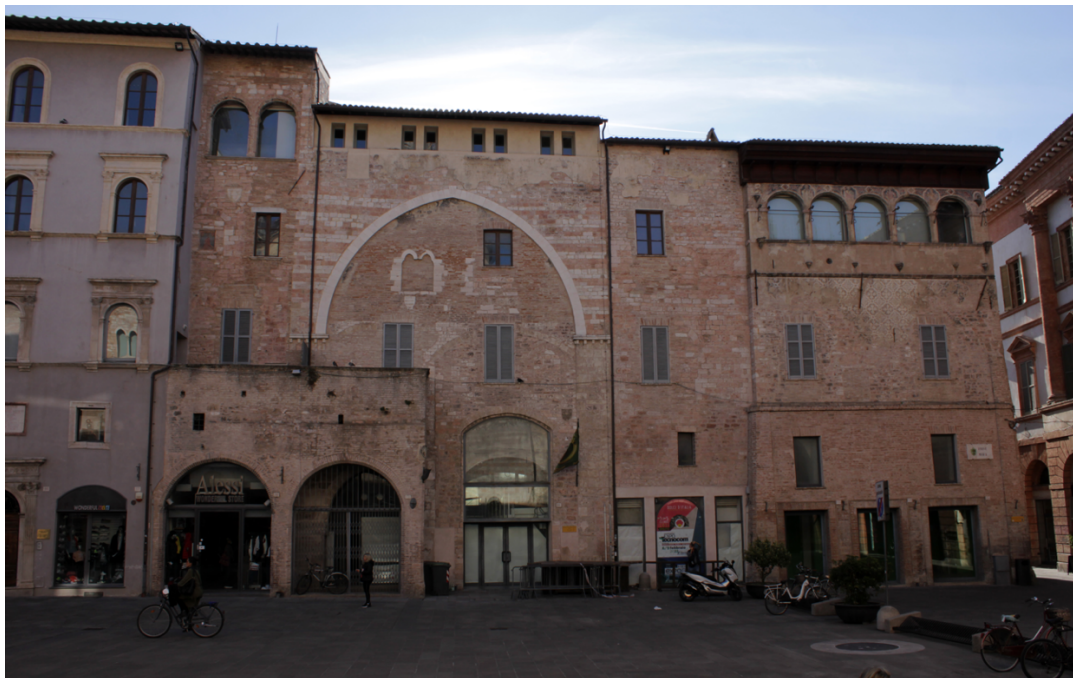
Fig. 6. Foligno, Palazzo del podestà , prospetto su piazza del Comune.

ostium quod est in pede scalarum palatii communis fulginei» 52 . Nel 1426 il «palatium communis Fulginei» era la «residentia dominorum priorum populi» 53 , accanto vi era l'abitazione del podestà «iuncta cum palatio communis» 54 .