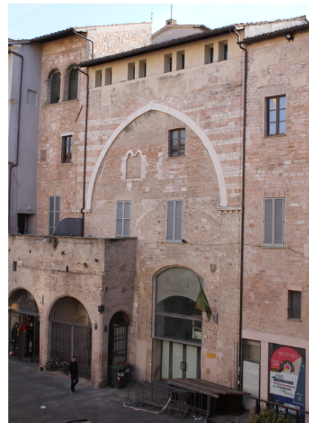
Fig. 8. Foligno, Palazzo del podestà (foto A. ottobre 2022).