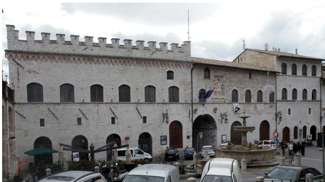
Fig. 2. Assisi, Palazzo dei Priori, corpo 1 e 2 (A 1 , A 2 ), prospetto su piazza del Comune (foto A. ottobre 2022).