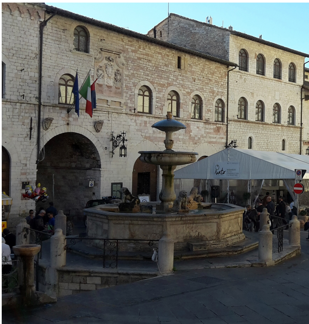
Fig. 4. Assisi, Palazzo dei Priori , corpo 2 (B), prospetto su piazza del Comune (foto A. ottobre 2022).

Un'analisi dettagliata, tuttavia, tende ad annullare le differenze tra i due corpi, in considerazione di due elementi: la presenza di un'unica cornice marcapiano e l'assenza di discontinuità tra la muratura del primo livello del corpo A 1 e A 2 20 .