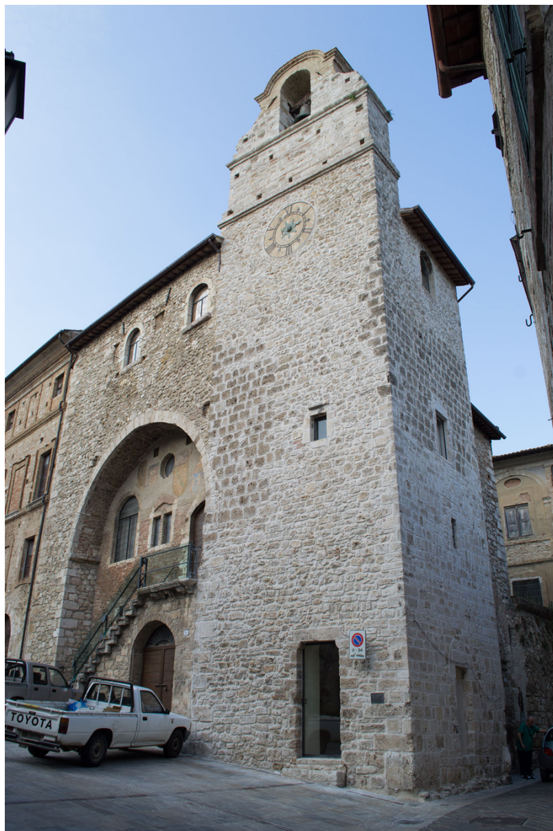
Fig. 9. San Gemini, Palazzo dei Priori (foto A. ottobre 2022).

sembrerebbe un unicum nel panorama peninsulare italiano, che sollecita ulteriori approfondimenti. Una soluzione affine si trova nel Lazio meridionale, nel palazzo comunale di Anagni, dove una sequenza di archi diaframma sorregge un solaio ligneo. In tale caso gli archi servono a coprire un ampio passaggio che si configura come una piazza coperta 60 . La circolazione di modelli era facilitata dalle maestranze e dai podestà che si muovevano tra i differenti comuni. Sarebbe da ricercare il prototipo per la costruzione del palazzo di Foligno nell'edilizia civile privata o nei palazzi vescovili e/o papali 61 .