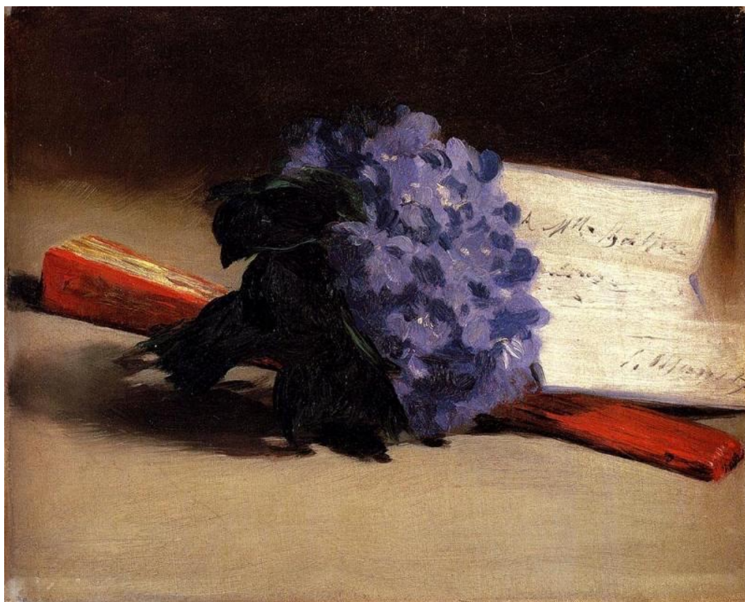
Fig. 8. Édouard Manet, Bouquet di violette e ventaglio , 1872, Parigi. Collezione privata.

Anche il racconto del piccolo quadro che Edouard Manet le destina, Bouquet di violette e ventaglio , (fig. 8) fattole recapitare dall'artista in «Un giorno di cielo basso» del 1872, oscilla tra realtà e immaginazione: l'opera che emerge dalla pagina scritta sembra caricarsi di quella malinconia che pervade la scena tratteggiata da parole di straordinaria capacità evocativa: «È bello, bellissimo: quella bellezza le dà il capogiro. Ma concepito con la crudeltà di un rebus che non ha bisogno di essere risolto, l'incrociarsi di oggetti suoi personali, espropriati dalla pittura, la ferisce, è un addio e non può ribellarvisi». E in quel foglio, con la dedica à Mlle Berthe Morisot É. Manet , inserito tra l'ametista dei fiori tanto amati dalla donna e il rosso lacca di un suo ventaglio, per un attimo ci sembra che Marisa Volpi abbia aggiunto la parola fine , a sigillo di un estremo congedo (fig. 9).