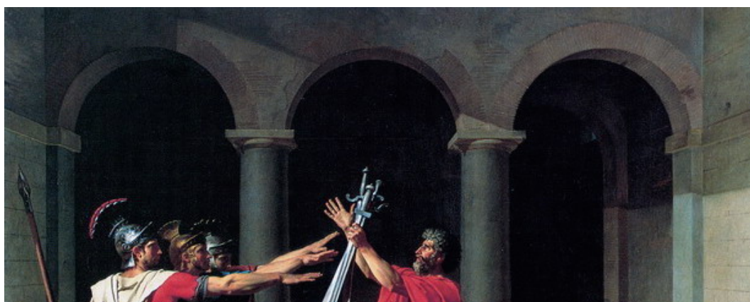
Fig. 3. Parigi, Museo del Louvre: Jacques-Louis David, particolare de Il giuramento degli Orazi 1784.

così diversi, tanto da rendere la lettura del libro scorrevole e unitaria come in un suggestivo romanzo? 27 Non può essere soltanto la “benignità” degli astri, come la chiamava il Vasari, la quale avrebbe segnato il loro comune destino nel percorso fortunato lungo la strada della pittura. Due elementi-guida appaiono affascinanti e ricorrenti nella lettura di un’opera che coinvolge ragione e sentimento: l’attrazione per l’Italia e le passioni profondamente vissute, le quali marcano intensamente la vita di ognuno dei protagonisti. Jacques-Louis David sarà soggiogato dalla grandezza del passato di Roma e se ne servirà « come di un robusto sentimento » per dar vita al nuovo classicismo. La luce fredda della luna scandisce il ritmo delle arcate classiche de Il giuramento degli Orazi , (fig. 3) come i suoi passi nei vagabondare notturni per le stradine vicino al Tevere sul finire del Settecento.