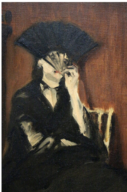
Fig. 7. Parigi, Musée d'Orsay: Édouard Manet, Berthe Morisot con il ventaglio , 1872, (da arte. Uno sguardo alla pittura del XIX secolo e del primo '900 ).