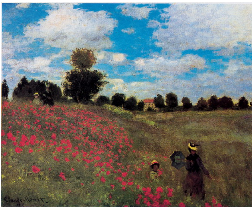
Fig. 6. Parigi, Musée d'Orsay: Claude Monet, I Papaveri , 1873.