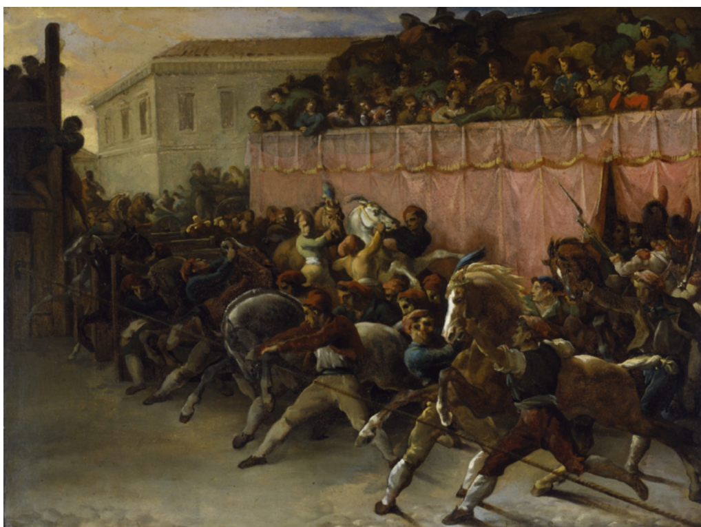
Fig. 4. Baltimora, Walters Art Gallery: Théodore Géricault, Corsa di cavalli , 1817 c.

4). Il rosso fiammeggiante sembra colorare anche la pagina scritta, le parole costruiscono forme cariche di emozioni, la prosa raggiunge ritmi concitati in un crescendo febbrile dal cui impatto si esce estenuati come il suo protagonista. In un'assonanza sconcertante e coinvolgente la scrittura di Marisa Volpi passa da una prosa incisiva ad una morbida, estenuata forma, fatta di umori e sensazioni che pervadono i nostri sensi fino a svelare i nostri sogni inquieti ed a tramutarci da lettori in protagonisti.