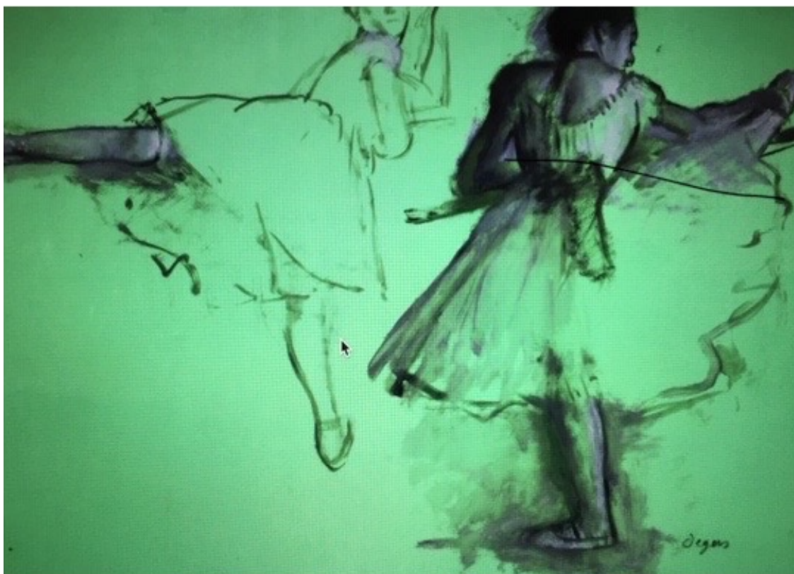
Fig. 5. Londra, British Museum: Edgar Degas, Ballerine alla sbarra , 1876-77 circa (foto da Stein, Perrin, French Drawings: Clouet to Seurat , British Museum Press, Londra, 2005).

Claude Monet, colui che aprirà « a colpi d'ascia » la strada verso una nuova pittura, appare nella sua intimità più segreta attraverso gli occhi della donna da lui amata e tradita: Camille, la sposa tante volte ritratta, alla fine dell'esistenza sembra evocare « il dolore di non averlo mai posseduto » e la sua immagine di piccola donna si fa sempre più minuta, come quando, in un famoso dipinto di pochi anni prima, emergeva appena nel tripudio delle macchie rosse dei papaveri (fig. 6). La vera passione di Claude è l'immagine, l'«impressione» della natura che i suoi occhi riescono a percepire, fino alla scoperta, quasi settantenne, di una progressiva cecità: a Venezia, la città della luce.