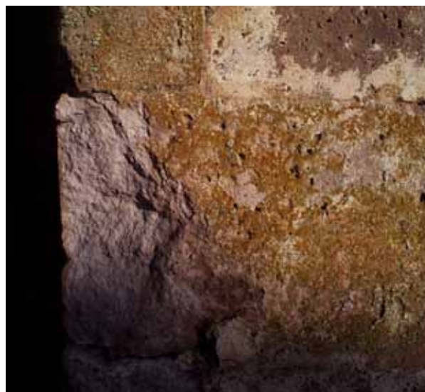
Fig. 17. Ozieri, Sant'Antioco di Bisarcio, pitting.