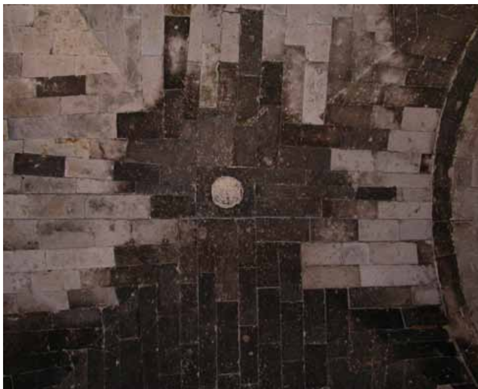
Fig. 5. Ozieri, Sant'Antioco di Bisarcio, bacino in una crociera dell'atrio.