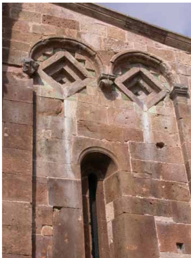
Fig. 13. Ozieri, Sant'Antioco di Bisarcio, rombi gradonati nel prospetto absidale.