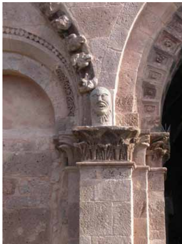
Fig. 15. Ozieri, Sant'Antioco di Bisarcio, decorazione della facciata dell'atrio.