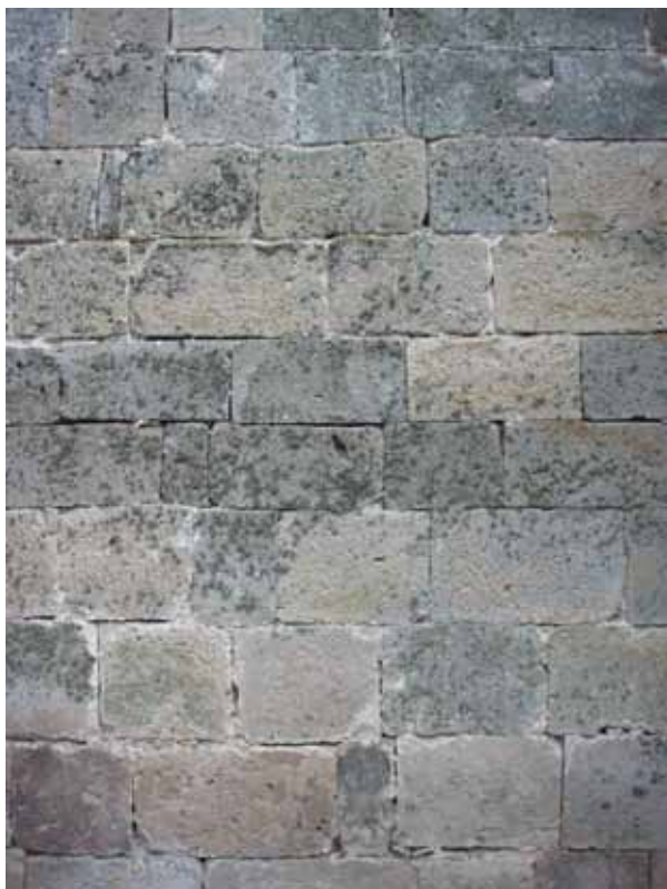
Fig. 14. Ozieri, Sant'Antioco di Bisarcio, paramento murario.