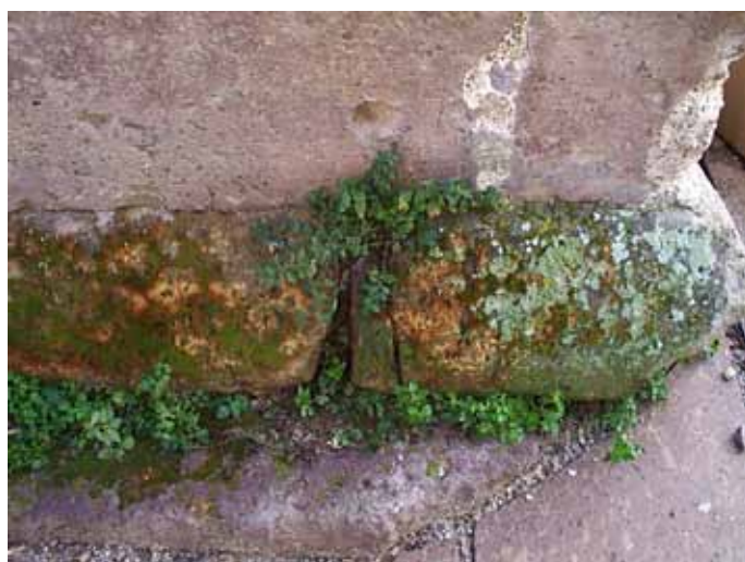
Fig. 20. Ozieri, Sant'Antioco di Bisarcio, patine biologiche.