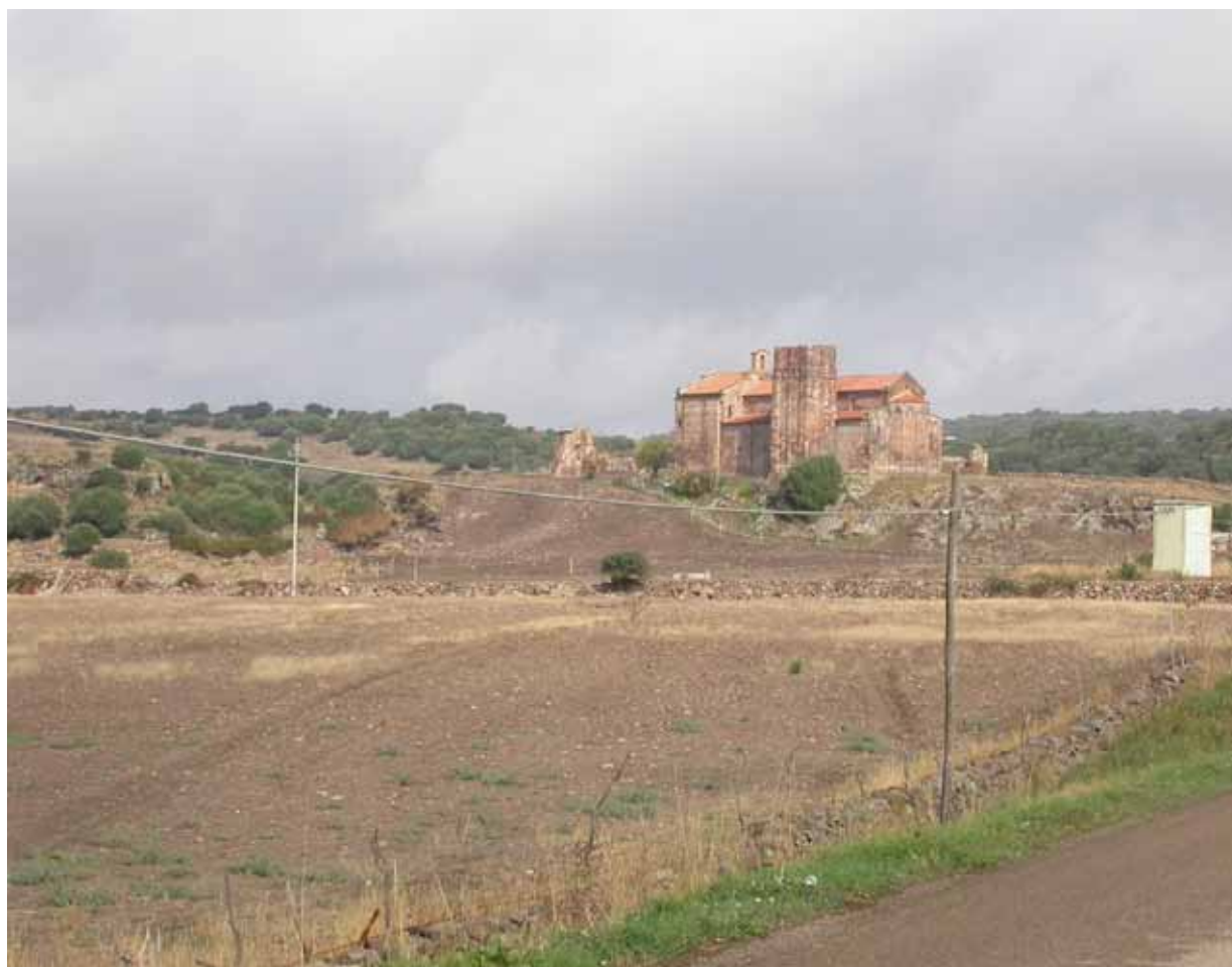
Fig. 1. Ozieri, il sito di Sant'Antioco di Bisarcio.

Virdis, M. ed. 2002. Il Condaghe di Santa Maria di Bonarcado . Cagliari: CUEC.