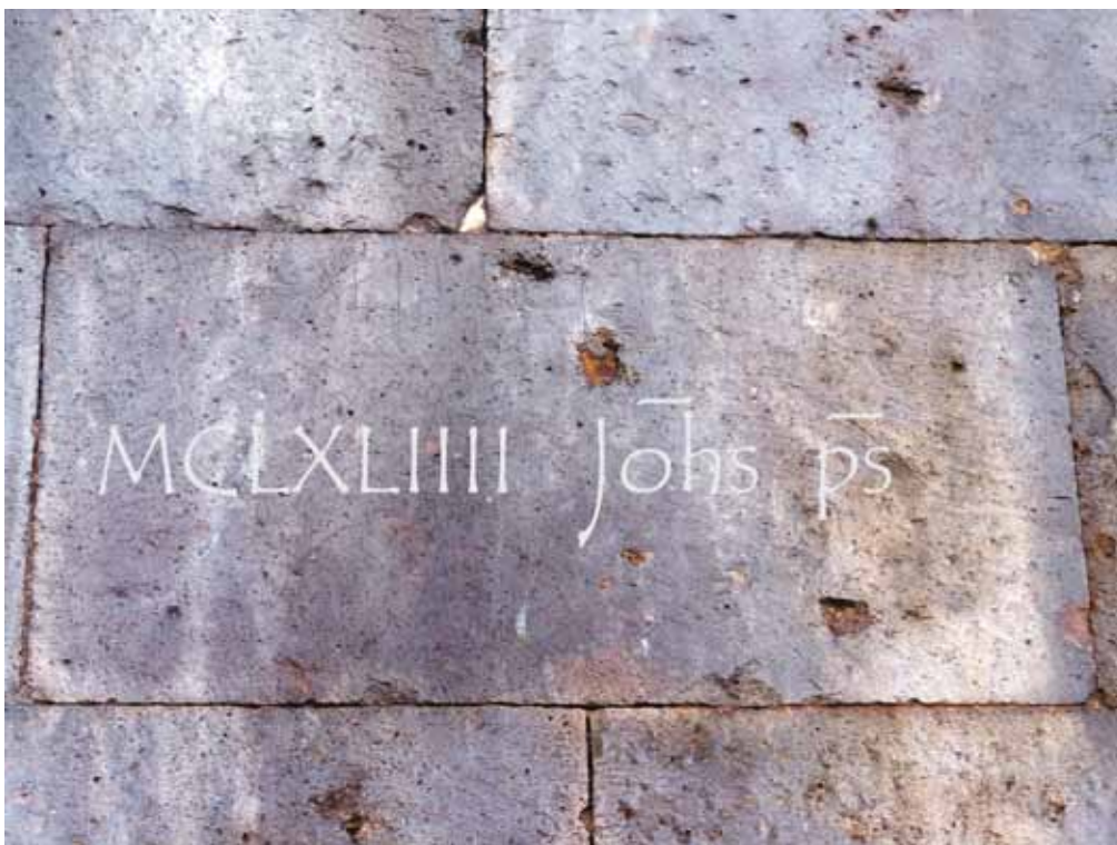
Fig. 7. Ozieri, Sant'Antioco di Bisarcio, epigrafe nel prospetto absidale.