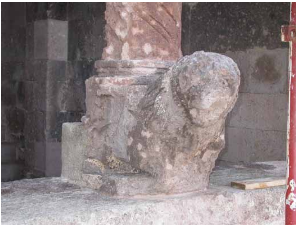
Fig. 6. Ozieri, Sant'Antioco di Bisarcio, leone stiloforo nell'atrio.