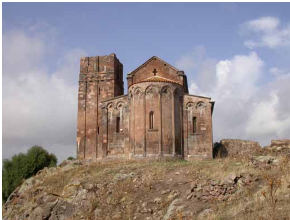
Fig. 10. Ozieri, Sant'Antioco di Bisarcio, prospetto absidale.