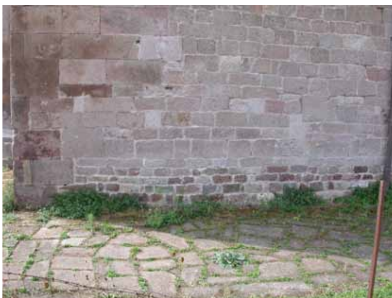
Fig. 9. Ozieri, Sant'Antioco di Bisarcio, porzione del fianco nord.