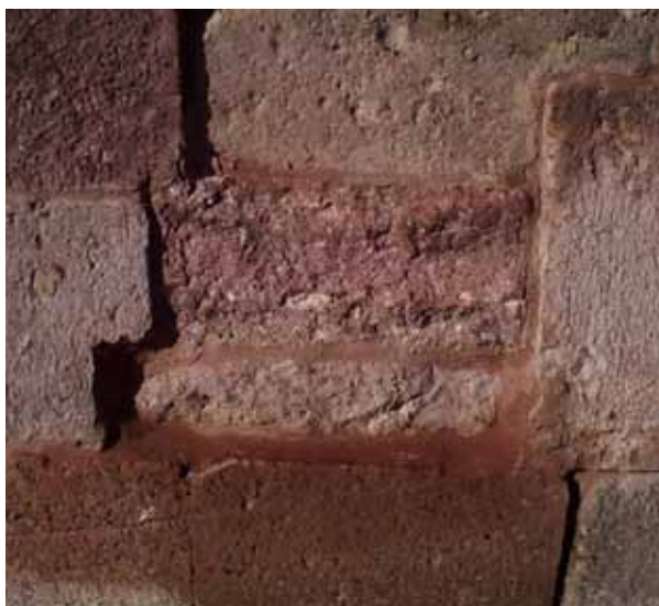
Fig. 16. Ozieri, Sant'Antioco di Bisarcio, conci degradati e conci di restauro (foto S. Columbu).