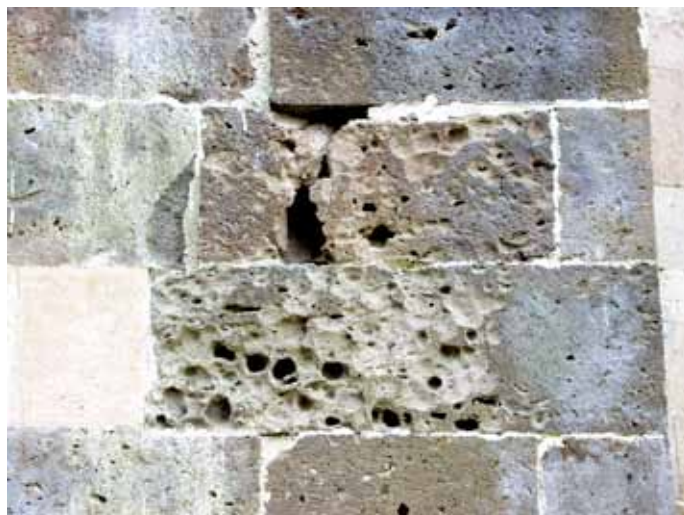
Fig. 18. Ozieri, Sant'Antioco di Bisarcio, alveolizzazione.