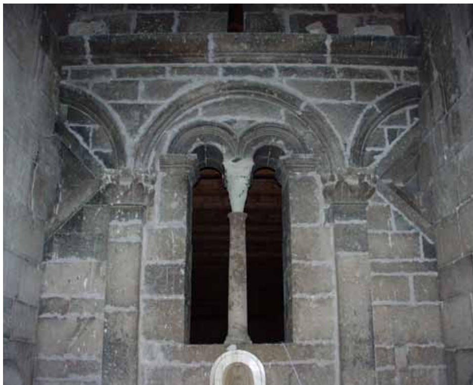
Fig. 4. Ozieri, Sant'Antioco di Bisarcio, bifora della facciata originaria.