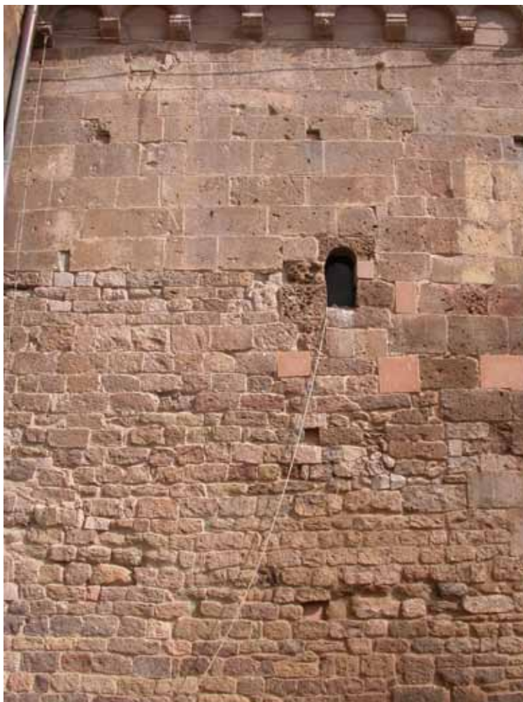
Fig. 8. Ozieri, Sant'Antioco di Bisarcio, porzione del fianco sud.