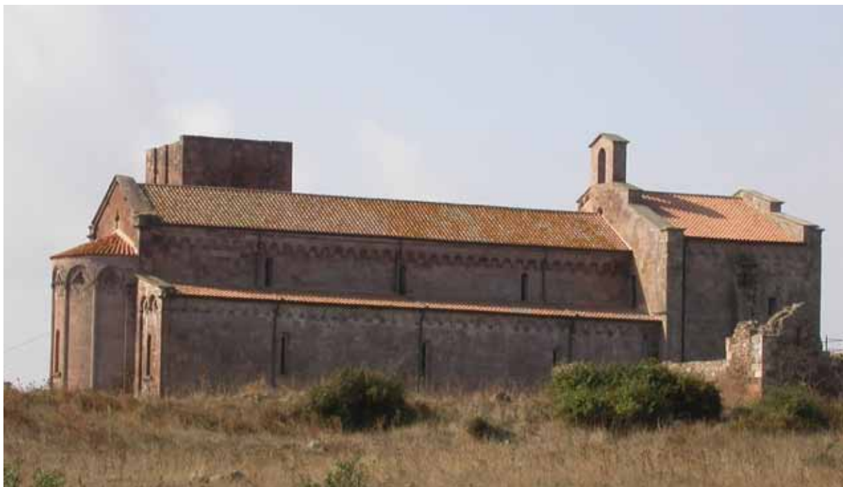
Fig. 12. Ozieri, Sant'Antioco di Bisarcio, prospetto nord.