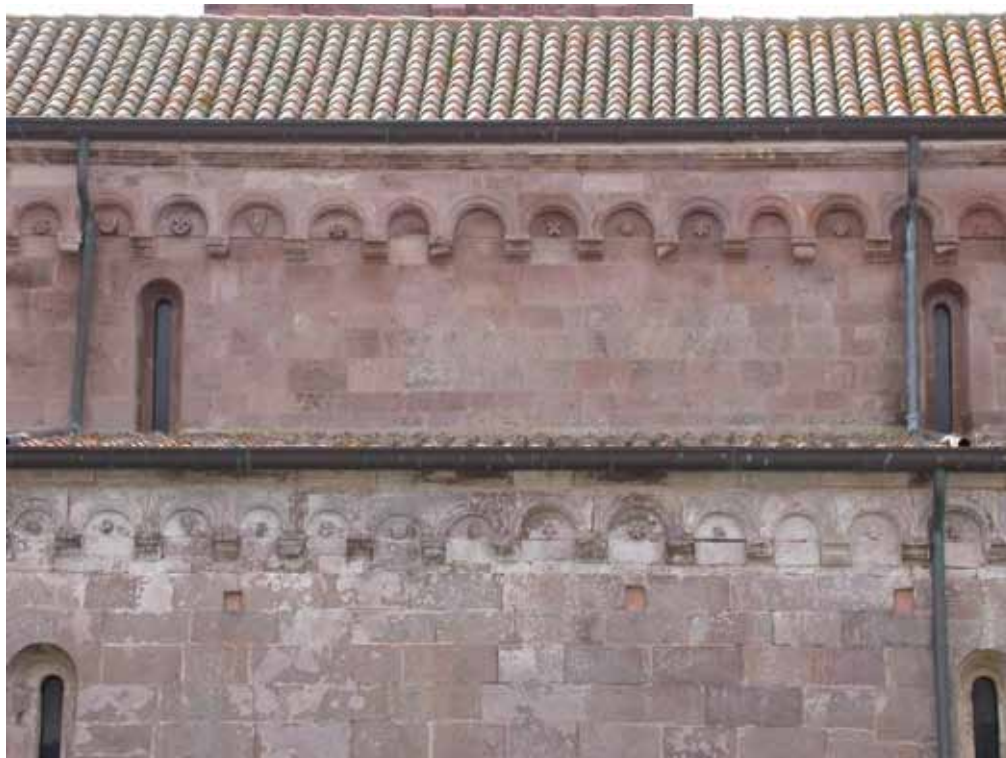
Fig. 11. Ozieri, Sant'Antioco di Bisarcio, archetti nel fianco nord.