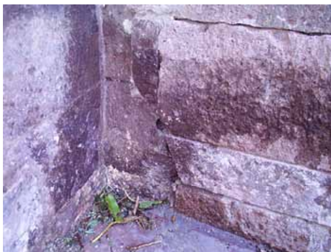
Fig. 19. Ozieri, Sant'Antioco di Bisarcio, croste d'alterazione.